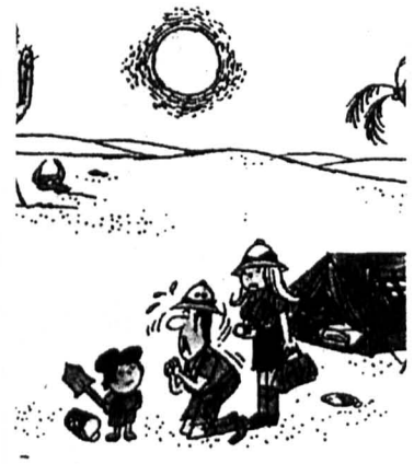
Dobrze, kupię Ci lego, ale powiedz, gdzie zakopałeś samochód!

* * * Pani pyta ucznia? - kto to jest poganiin? uczeń odpowiada - to taki człowiek - który pogania batem.