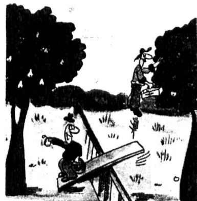
Jednak, co sąsiad, to sąsiad

* * * Dyrektor do sekretarki - czy ogłoszenie że szukamy stróża co miasto jakiś skutek: - Tak panie dyrektorze Dziś w nocy ukradziono magazyn.