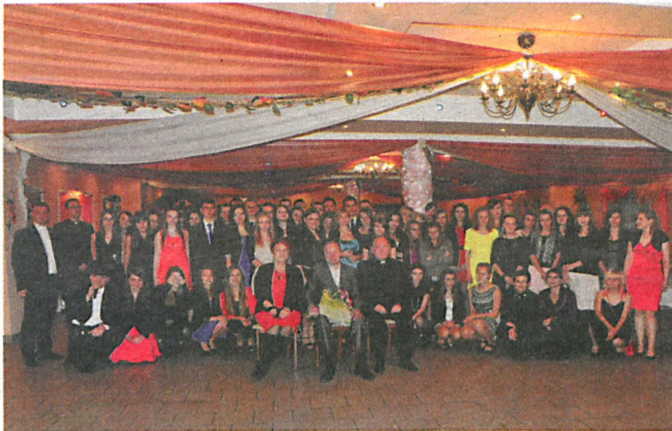
Na Bal przybyli ci, którzy chcieli czuć się wolni, bawiąc się bez procentów

Mimo, że na imprezie nie było alkoholu, tym którzy przybyli taka forma zabawy przypadła do gustu. Już od pierwszych minut trwały zabawy integracyjne. Był też pokaz taneczny formacji Amigo Dance, połączony z krótką nauką kroków oraz konkursem. Zabaw i konkursów było znacznie więcej, ci którzy wzięli w nich udział, wygrali nagrody. Młódzież zgodnie podkreślała, że warto było przyjść na taką imprezę. Uczestnicy przyznawali, że bardzo dobrze i bezpiecznie czuli się w niepijącym