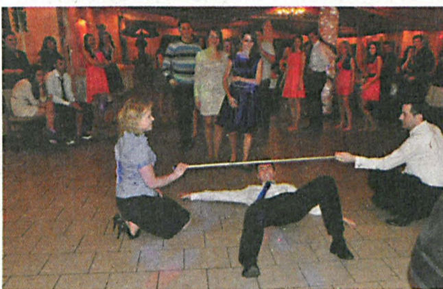
Młódzież chętnie brała udział w konkursach z nagrodami