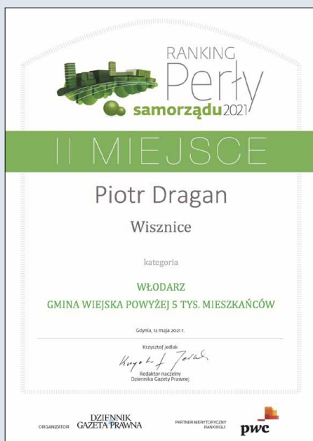
Grafika: Urząd Gminy Wisznice