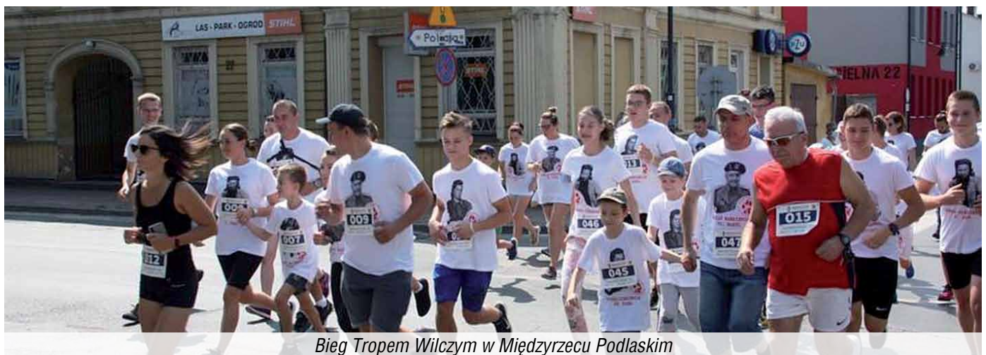
Bieg Tropem Wilczym w Międzyrzecu Podlaskim