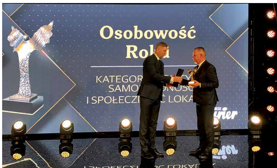
Fotografie: Starostwo Powiatowe w Białej Podlaskiej

Materiał: Starostwo Powiatowe w Białej Podlaskiej