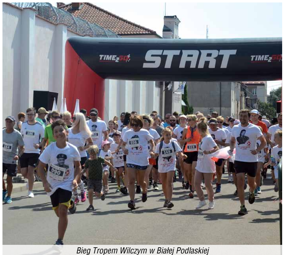
Bieg Tropem Wilczym w Białej Podlaskiej