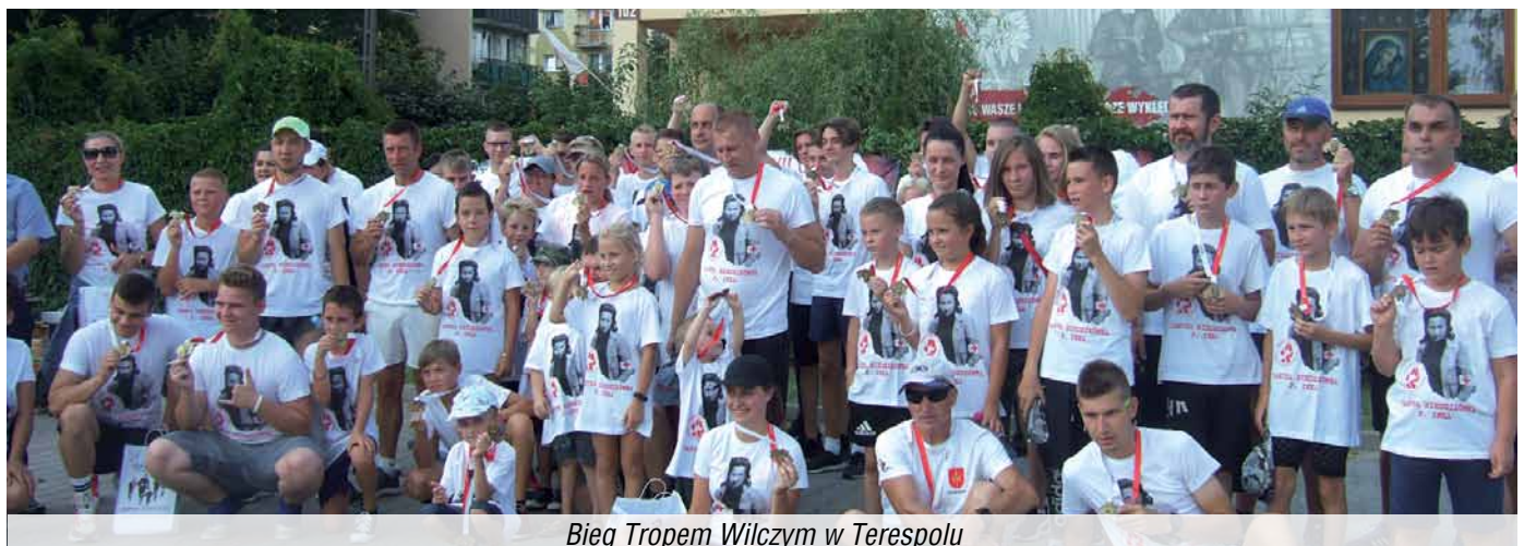
Bieg Tropem Wilczym w Terespolu