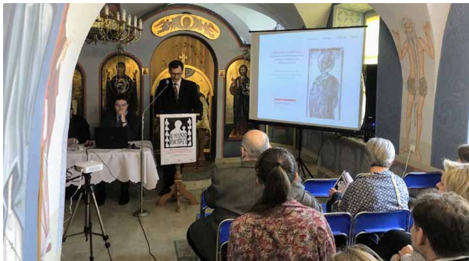
Fot. Facebook Konferencja naukowa „Wielkie powroty”

politej odnosząc się do utraconych i wywiezionych zabytków. W trakcie konferencji odbyło się osiem sesji naukowych, w trakcie których zostało wygłoszonych 35 referatów, dotyczących: artystycznej spuścizny polskiego prawosławia, cudownych i czczonych ikon, malarstwa monumentalnego, architektury cerkiewnej, rękopiśmiennej tradycji cyrylickiej dawnej Rzeczypospolitej, rękopisów muzycznych, prób rekonstrukcji tradycji muzycznej polskiego prawosławia, losów dzwonów cerkiewnych, zbiorów muzealnych, zbiorów archiwalnych, działalności na rzecz ochrony zabytków, losów zabytków wywiezionych w czasie I Wojny Światowej, a także strat, które przyniosły ze sobą II Wojna Światowa i akcje przesiedleńcze.