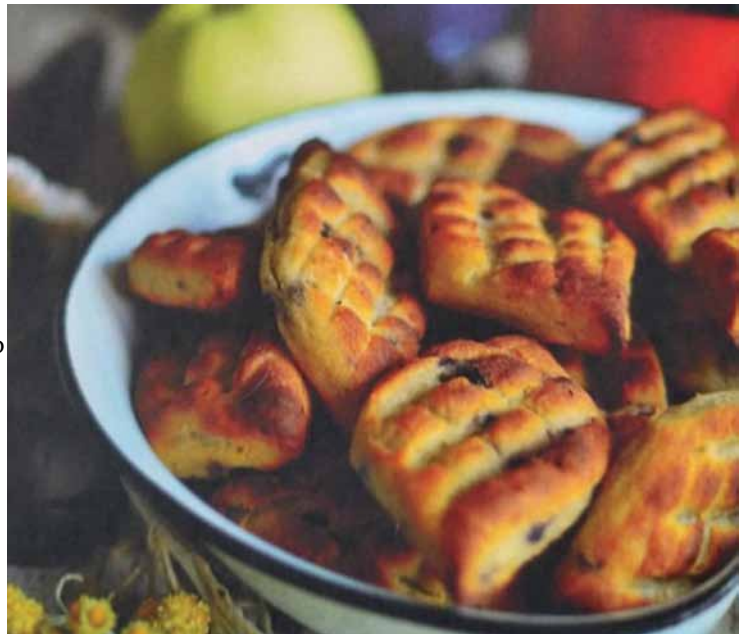
Fot. „Fosilina kuchnia regionalna” Paweł Ochman