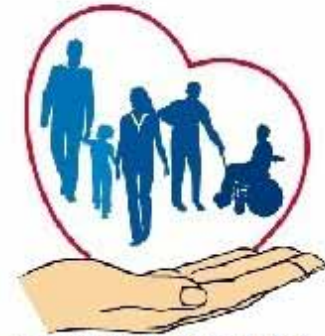
POWIATOWE CENTRUM POMOCY RODZINE W BIAŁEJ PODLASKIEJ