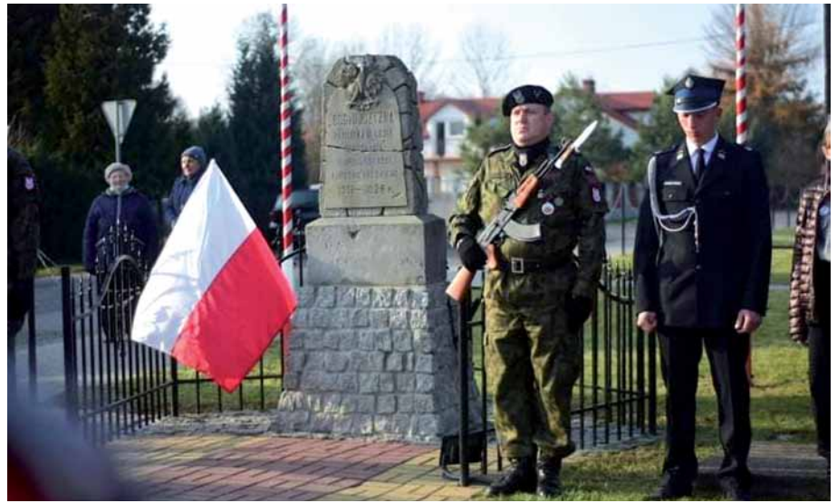
gm. Biała Podlaska

W podniosłej atmosferze patriotyzmu mieszkańcy oraz przedstawiciele władz samorządowych brali udział w uroczystościach Święta Niepodległości. Tego dnia odprawiano msze święte w intencji Ojczyzny oraz składano kwiaty w miejscach pamięci, by uczcić kolejną rocznicę odzyskania niepodległości przez Polskę.