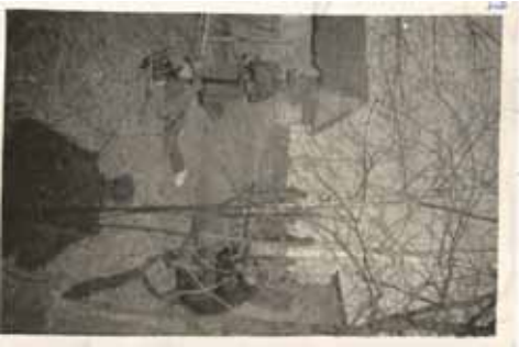
Żołnierze Szkoły Podchorążych na ćwiczeniach

Oprócz zajęć praktycznych odbywały się szkolenia ideowo- polityczne. Kształtując patriotyczne postawy zwracano uwagę na pozytywne cechy charakteru, a więc: koleżeństwo, sumienność, uczciwość, odwagę, współpracę, zdyscyplinowanie, lojalność, życzliwość. Kadeci poznawali też sylwetki i życiorysy bohaterów narodowych oraz bohaterów kampanii wrześniowej, a w czasie wolnym śpiewali wojskowe piosenki partyzanckie: My ze spalonych wsi, Już dopała się ogień, kołysankę. Dziś do Ciebie przysię nie mogę . Po dniu ćwiczeń na świętym powietrzu chłopakom dopisywały aperty. Wyznaczono kucharza i jego pomocnika, były też trzy sanitariuszki, które w wolnych chwilach pomagały kucharzowi. Od miejscowej ludności kupowano świnie lub krowę, w razie braku pieniędzy w sklepie spożywczym dawano produkty na kredyt, a miejscowe kobiety przynosiły jajka i piekły chleb. Na śniadanie najczęściej był chleb z marmoladą i kawa, na obiad zupa z z porcją mięsa, na kolację chleb z jajecznicą. Gdy moja mama w czasie wizyt częstowała wujka jajecznicą, wspominała tamte czasy: To wielkonoce/jedzenie- tak mówili/choopy w lesie- dodawał .