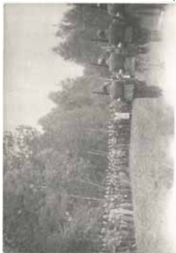
Zakończenie Szkoły Podchorążych

Nadeszła upragniona wolność. Początkowo ruch partyzancki, który później tworzył oddziały Batalionów Chłopskich wniósł ogromny wkład w odzyskanie wolności. Oddziały te w przeważającej części stanowił synowie polskiej wsi zahartowani do trudnych warunków