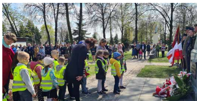
Fot. Gmina Kodeń