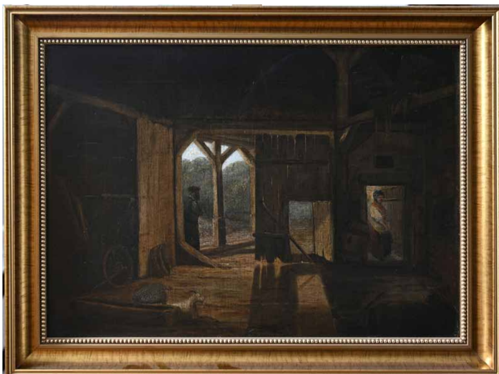
Fot. Tadeusz Żaczek. Józef Ignacy Kraszewski, Wnętrze stodoły w Kisielach

Materiał: Dorota Uryniuk – Wydział Spraw Społecznych