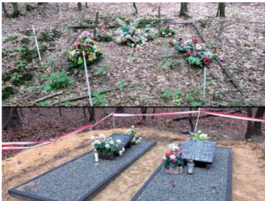
Mogiły wojenne w Dokudowie Drugim

W 2021 roku samorząd otrzymał od wojewody dotację w wysokości 12,5 tys. zł z przeznaczeniem na prace remontowe, konserwacje i utrzymanie dotyczące wszystkich obiektów grobownictwa wojennego na terenie gminy. Dzięki tym pieniądzą, na przełomie listopada i grudnia ubiegłego roku wyremontowano trzy obiekty grobownictwa wojennego, których stan zachowania wymagał podjęcia natychmiastowej interwen-