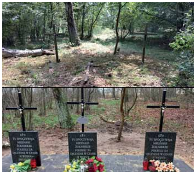
Mogiły wojenne w Ortelu Książęcym Pierwszym

Materiał: Wiadomości Gminne Biała Podlaska