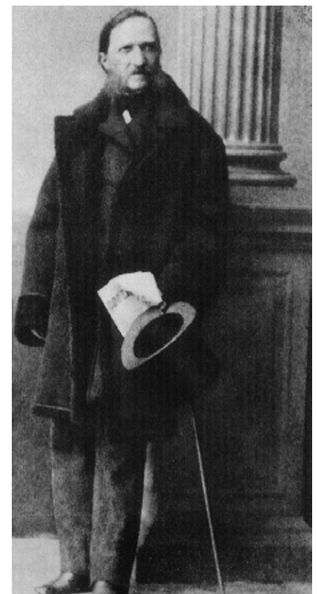
Józef Ignacy Kraszewski z egzemplarzem Gazety Codziennej w dłoni

W 1859 roku Leopold Kronenberg składa pisarzowi propozycję objęcia funkcji redaktora Gazety Codziennej . Jak pamiętamy, w tym okresie pisarz popada w konflikt ze szlachtą wołyńską w kwestii włościańskiej, między innymi po opracowaniu Memoriału w sprawie włościańskiej . Propozycja ta więc była swoistego rodzaju wybawieniem . Zaangażował się niesamowicie w prowadzenie gazety i okazał się bardzo sprawnym redaktorem, potrafiącym zadbać o atrakcyjność pisma,