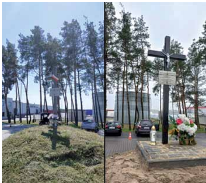
Zbiorowa mogiła Powstańców Styczniowych w Woskzrenicach Dużych