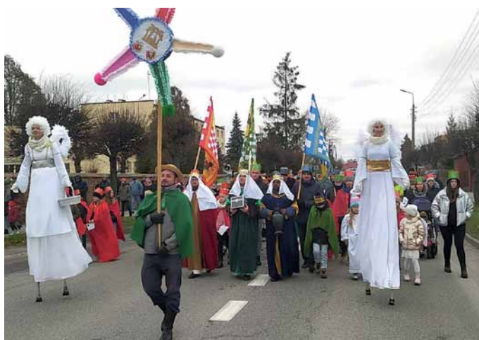
Fot. Leśna Podlaska