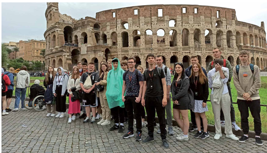
Fot. Izabela Hodun (koordynator wyjazdów uczniów ZSE na staże zagraniczne)