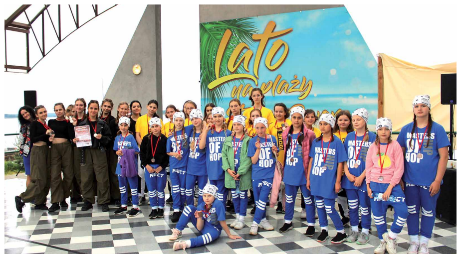
Fot. Magdalena Wieczorek