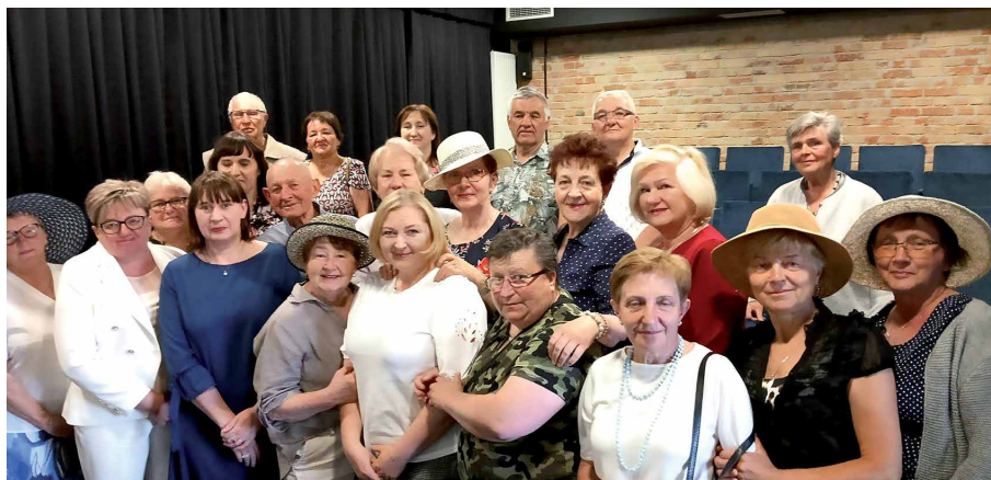
Fot. Dyrekcja i pracownicy Gminnej Biblioteki Publicznej w Piszczacu

24 maja 2023r. miała swoją premierę nowa powieść tej autorki pt. „Kamienica”. Jest to pierwsza część z czterech powieści cyklu „Sekrety Białej”. Tym