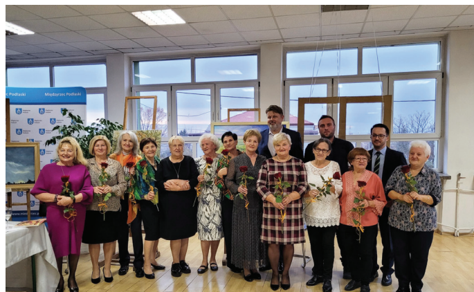
Międzyrzeckie seniorki odnalazły się w swoich rolach