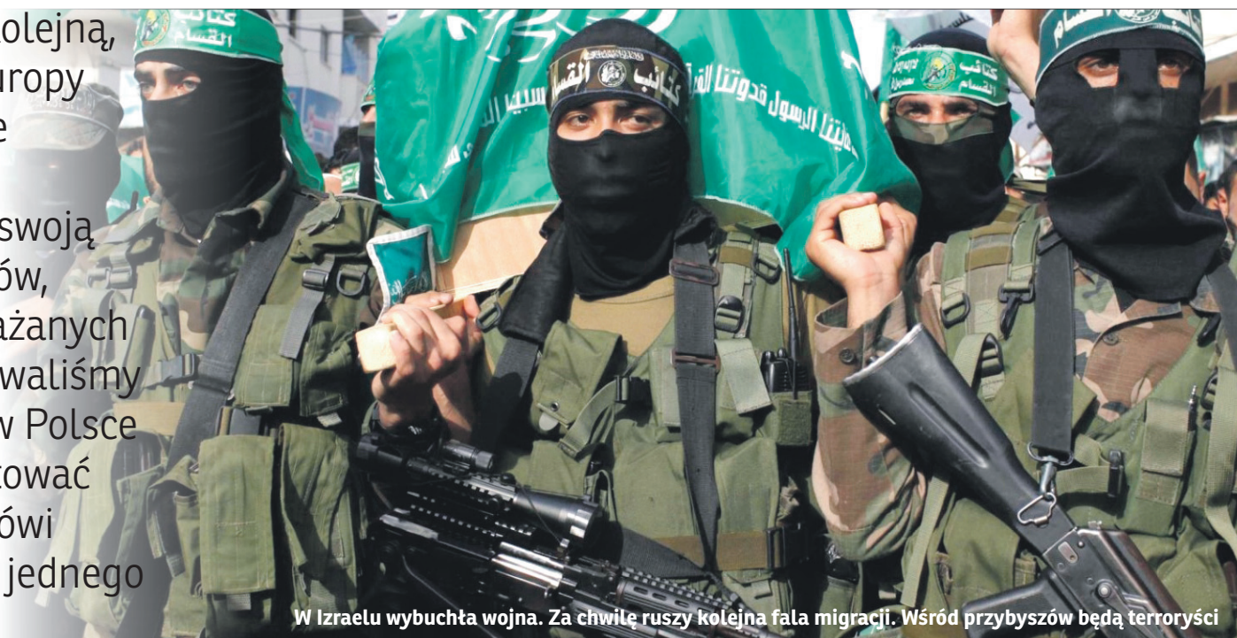
W Izraelu wybuchła wojna. Za chwilę ruszy kolejna fala migracji. Wśród przybyszów będą terroryści

Wojna w Izraelu spowoduje kolejną, wielką falę migrantów. Do Europy będą chcieli przeniknąć także terroryści z Hamasu i innych organizacji. Musimy chronić swoją granicę i wspierać jej obrońców, brutalnie atakowanych i obrażanych przez opozycję. – Nie spodziewaliśmy się nigdy tego, że znajdą się w Polsce ludzie, którzy zaczną demontować nasze granice od środka – mówi w specjalnym nagraniu żona jednego ze strażników granicznych.