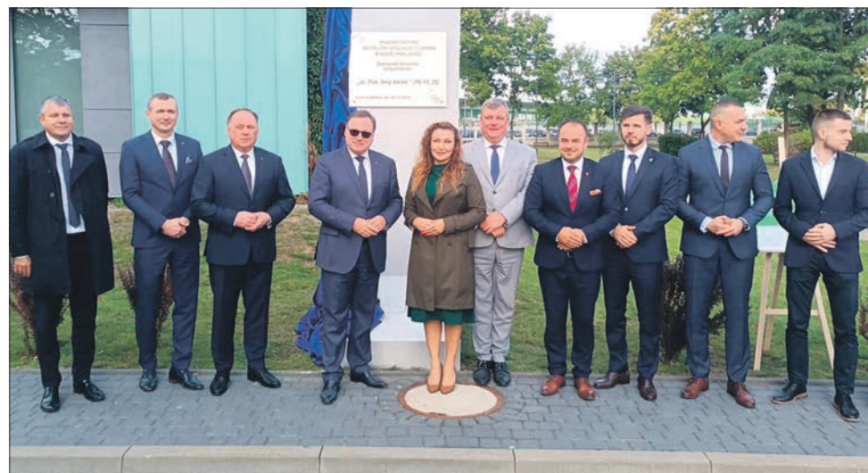
W minionym tygodniu wmurowano kamień węgielny pod nową część szpitala w Białej Podlaskiej

– Cieszy mnie, że nasi wójtowie stanęli na wysokości zadania i bardzo aktywnie starali się o pieniądze służące rozwojowi ich małych ojczyzn. Jak patrzę na to, co uzyskał Drelów, Janów Podlaski, Siemień, Komarówka Podlaska, każda inna gmina, to serce rośnie. To przecież drogi, szkoły, infrastruktura komunalna czy edukacyjna, z których będą korzystały te i przyszłe pokolenia – dodaje Bierecki.