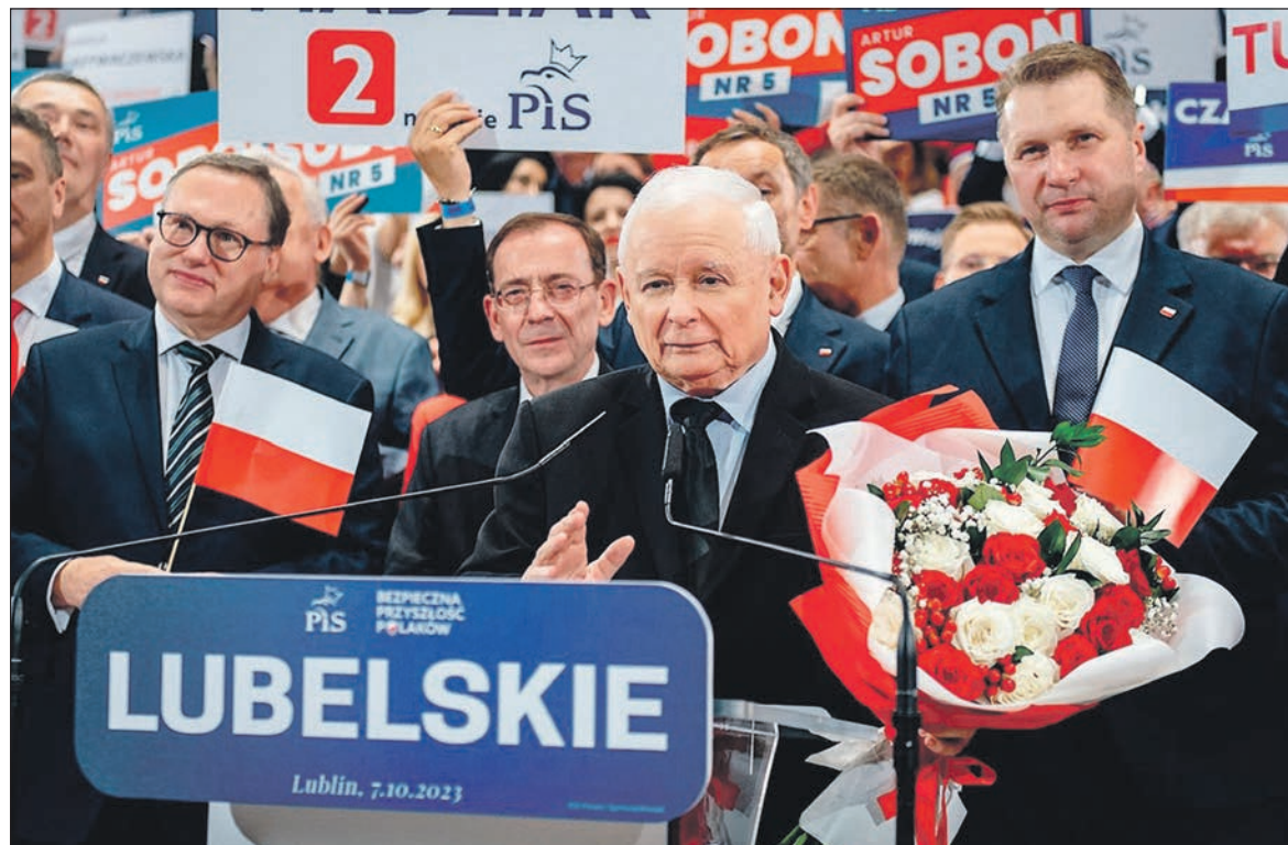
Na konwencji PiS spotkali się kandydaci PiS z naszego okręgu

Nowy, obszerny program, kompromitacja Tuska w debacie TVP i niezłe wyniki sondażowe PiS – to wszystko sprawia, że partia Jarosława Kaczyńskiego jest faworytem wyborów. Lider Zjednoczonej Prawicy prosi jednak wszystkich o mobilizację do końca. Przestrzega też przed powrotem „systemu Tuska”, z biedą, bezrobociem i niesprawiedliwością a także podkreśla zagrożenia związane z wojną i migrantami.