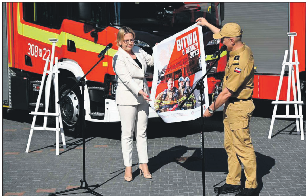
Minister Środowiska Anna Moskwa ogłasza „Bitwę o remizy”

Wybory to najważniejszy dzień w każdej demokracji. Warto wziąć w nich udział i mieć wpływ na przyszłość Polski. Dzięki rządowym akcjom profrekwencyjnym można też zdobyć wielkie pieniądze dla naszych gmin i strażaków.