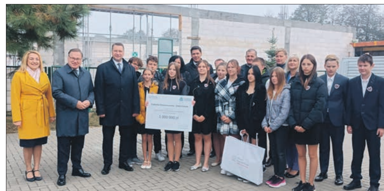
Dzisiaj placówka jest bezpieczna. Rozwija się dzięki przyjaciółom szkoły. Przykład: budowana sala gimnastyczna

po prostu chciał walczyć o szkołę dla swoich dzieci – Jak się szybko okazało: nie ja jeden. Zaczęliśmy spotykać się u mnie w domu. Powołaliśmy Społeczny Komitet Wsparcia, napisaliśmy do prezydenta miasta apel o zaniechanie zamiaru likwidacji szkoły, pod którym podpisało się 618 mieszkańców.