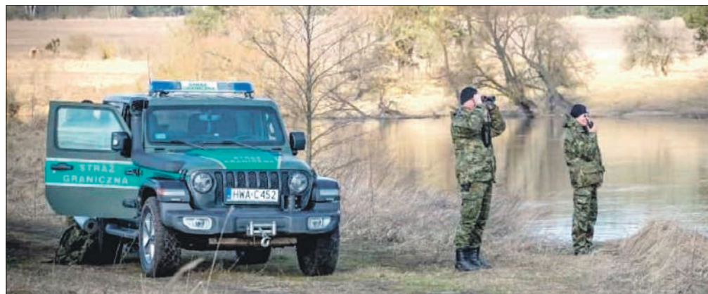
Nasze bezpieczeństwo spoczywa na barkach strażników granicznych

W takich chwilach szczelna granica to być albo nie być dla Polski. Tymczasem wielu przedstawicieli opozycji nie tylko domaga się zburzenia muru na granicy, jest za przymusową relokacją migrantów do Polski ale też od mie-