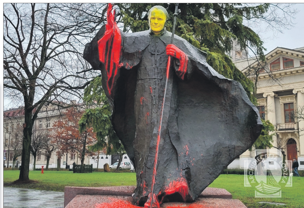
Zdewastowany pomnik Ojca Świętego w Łodzi. Nie chcemy takich rzeczy u nas!