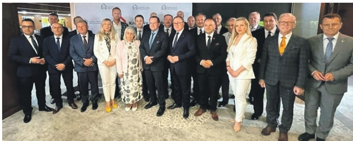
W inicjatywie bierze udział 15 gmin z terenu Południowego Podlasia

Mieszkaniowe tworzone są we współpracy z samorządami, proces zgłaszania wniosków o dostęp do mieszkań prowadzony jest we współpracy z urzędami gminy. Osoby, które spełniają