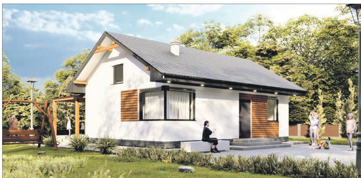
Tego typu domy, w zabudowie bliźniaczej, staną w naszych gminach