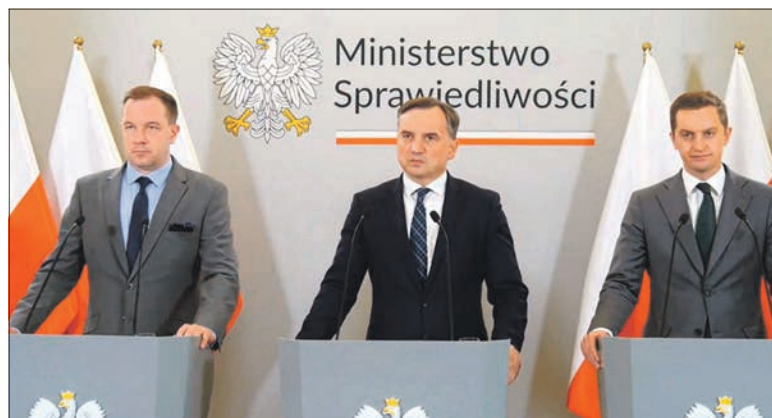
Zbigniew Ziobro zapewnia, że dla pedofilii nie będzie litości

– Doszło do przeszukań mieszkań w Warszawie i Szczecinie. Zabezpieczono kilkadziesiąt urządzeń z danymi elektronicznymi, między innymi z treściami komunikatorów społecz-