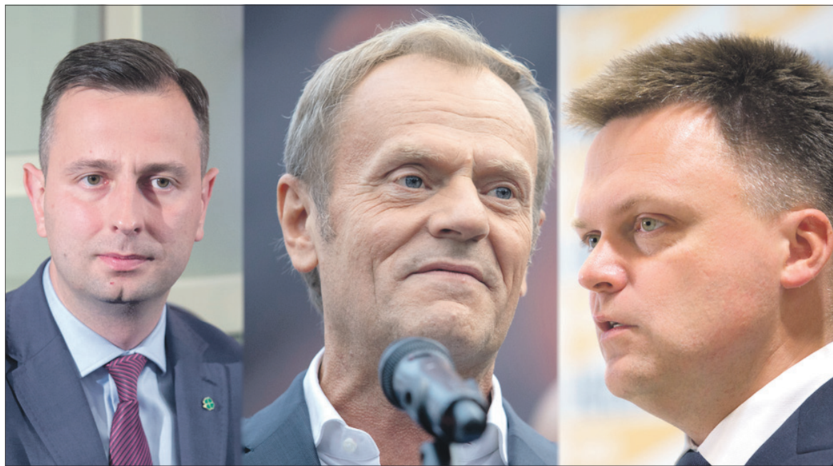
Władysław Kosiniak-Kamysz i Szymon Hołownia chcą koalicji z Donaldem Tuskiem

prezentować niemal wyłącznie ludzie Hołowni. Jest wśród nich np. zwolenniczka aborcji na życzenie Joanna Mucha czy człowiek Leszka Balcerowicza i fan prywatyzacji Ryszard Petru. Trudno nie zauważyć u działaczy Polski 2050 lekceważenia dla swojego egzotycznego koalicjanta ze wsi. Na debatę do TVP poszedł Hołownia a nie lider PSL. Dlaczego? Wytłumaczyła to Joanna Mucha. – Według sondaży Polska 2050 znacznie więcej waży w koalicji. Mamy sondaże, z których wynika,