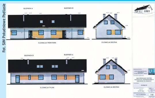
Już niebawem ruszą prace projektowe