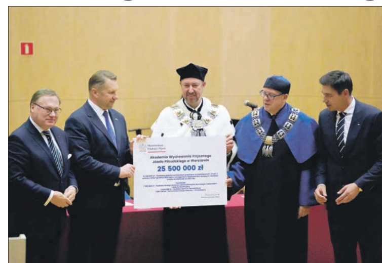
Minister Przemysław Czarnek przekazał naszej uczelni czek na 25 milionów zł

trum rehabilitacji i termomodernizację budynków akademii oraz 15 mln w obligacjach na kolejne inwestycje. Szef MEiN uczelnię nazwał białską uczelnią „najbardziej rozwiniętą infrastrukturalnie AWF-em w całej Polsce”. Obecny podczas inauguracji senator Grzegorz Bierecki wyraził wdzięczność ministrowi Czarnekowi, że ten od lat wspiera białskie uczelnie wyższe i przypomniał, że to dzięki decyzjom ministra Państwowa Szkoła Wyższa stała się Akademią Białską i otworzono jej filię w Radzynie Podlaskim