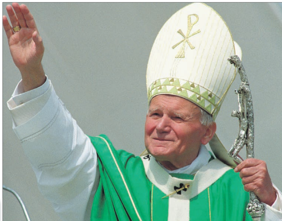
Święty Janie Pawle II, módl się za nami!

„Ty nas obudziłeś, my Cię obronimy” – tak brzmiało hasło tegorocznego Krajowego Zjazdu Delegatów NSZZ „Solidarność” i takie przesłanie widnieje na malowidle. Związkowcy wyrazili w ten sposób swoją pamięć kluczowej roli św. Jan Paweł II we wspólnej walce Polaków o wolną, suwe-