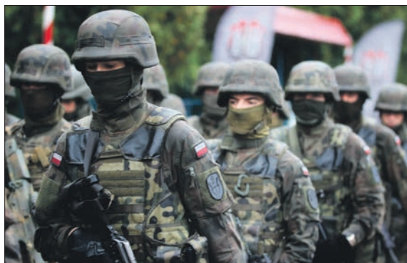
Żołnierze Wojska Polskiego są u nas już na stałe!