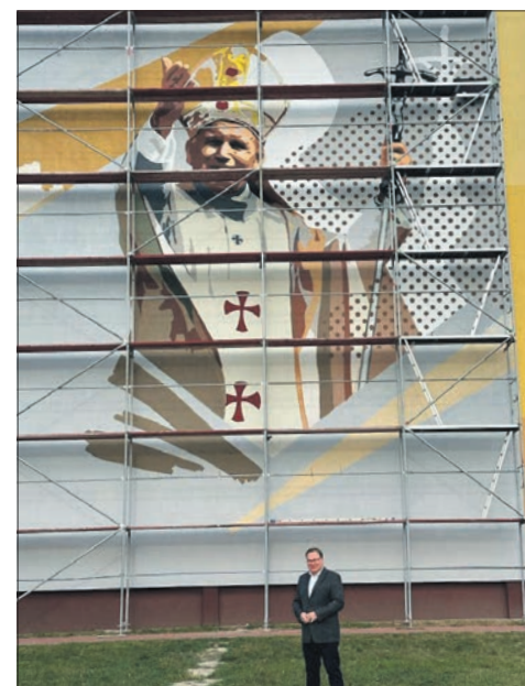
Mural powstał dzięki wsparciu fundacji Grzegorza Biereckiego a także władz województwa lubelskiego

– Byłem jednym z tych, których św. Jan Paweł II obudził, wezwał do wiary i działania swoim zawołaniem „Nie lękajcie się!” – podkreśla senator Grzegorz Bierecki, uczestnik opozycji antykomunistycznej lat 80. i więzień reżimu Wojciecha Jaruzelskiego. – Jesteśmy winni Naszemu Papieżowi wdzięczność, ale przede wszystkim prawdę i pamięć. Tej prawdy trzeba dziś ze wszystkich sił