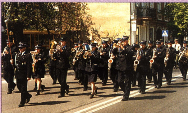
Orkiestra Ochotniczej Straży Pożarnej