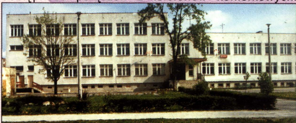
Szkoła Podstawowa nr 3

Prawie całe miasto objęte jest siecią wodociągową. Obecnie 66% gospodarstw domowych podłączonych jest do zmodernizowanej oczyszczalni ścieków. Około 15 % mieszkań osiedli domów jednorodzinnych podłączonych jest do sieci gazowej, rozbudowuje się sieć ogrzewania miasta z kotłowni miejskiej. Miasto posiada około 4400 numerów telefonów oraz dostępność połączeń z telefonów komórkowych.