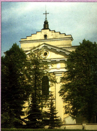
Kościół św. Mikołaja

następnych wiekach poprzez rozwój rzemiosła i handlu nabierało znaczenia, by w XVIII w. stać się największym środkiem miejskim na Podlasiu. Włości międzyrzeckie były własnością możnych rodów Zabrzezińskich, Sapiehów, Tęczyńskich, Lubomirskich, Sieniawskich, Czartoryskich i Potockich. Dopiero w 1866 roku po wydzieleniu z dóbr Potockich gruntów miejskich i uwłaszczeniu mieszkańców miasto przestało być prywatne. Nie omijały go klęski żywiołowe - wielki pożar, powódzie, epidemie, głód i zniszczenia wojenne w czasie najazdów Chmielnickiego, Szwedów, wojsk moskiewskich, powstań narodowych. W XIX wieku Międzyrzec Podlaski wszedł w skład Księstwa Warszawskiego a następnie Królestwa Polskiego. Podczas II wojny światowej miasto poniosło ogromne straty. Hitlerowski holocaust w 1942 i 1943 r. unicestwił ludność żydowską. Na przestrzeni wieków w okresie międzywojennym i obecnie Międzyrzec Podlaski jest znaczącym ośrodkiem życia gospodarczego, handlowego oświatowego i kulturalnego na Podlasiu.