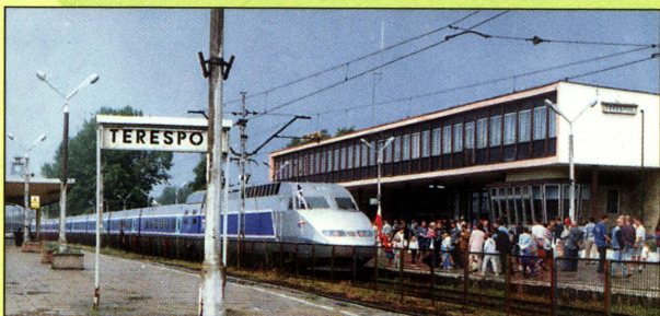
TGV w Terespolu

Sieć oświatową tworzą 2 Szkoły Podstawowe, 2 Gimnazja Publiczne oraz Liceum Ogólnokształcące. Funkcjonuje również Przedszkole Miejskie.