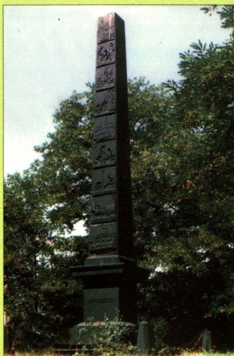
Obelisk "traktu brzeskiego" z 1825 roku

Ciekawostką turystyczną Terespoła pozostaje żelazny obelisk wzniesiony w 1825 roku dla uczczenia budowy traktu Brześć – Warszawa. Baza hotelowa ogranicza się do małego hoteliku w mieście oraz hotelu na terenie miejskiego stadionu sportowego.