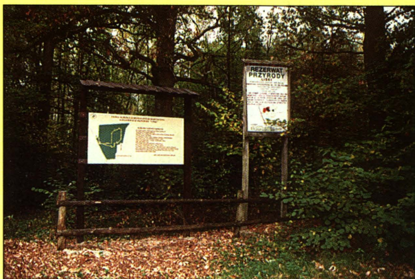
Rezerwat Przyrody "Liski"