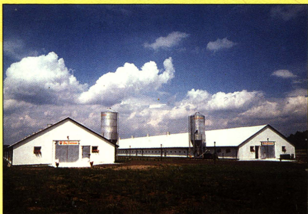
Kurnik do tuczu drobiu M. Wolskiego w Zahajkach

Gmina dysponuje 34 km sieci wodociągowej ze 220 przyłączami. Telefonizacja gminy kształtuje się na poziomie 100 %. Sieć oświatową tworzy 6 szkół podstawowych i 2 szkoły filialne oraz 2 gimnazja. Opiekę zdrowotną zapewnia Gminny Ośrodek Zdrowia w Drelowie oraz Wiejski Ośrodek Zdrowia w Szóstce.