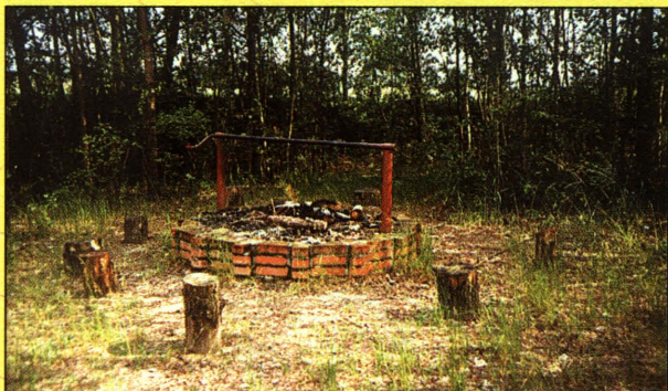
Gospodarstwo agroturystyczne Stanisława Sawczuka w Łózkach - palenisko z rożnem

Godnymi uwagi są obiekty sakralne w Witorożu, Szóstce, Drelowie i Dołdze, drewniane kapliczki z XIX wieku oraz wiatrak w Zahajkach.