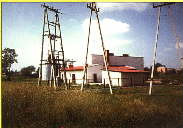
Ujęcie wody - Hydrofornia w Drelowie