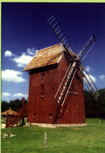
Wiatrak w Zaborku