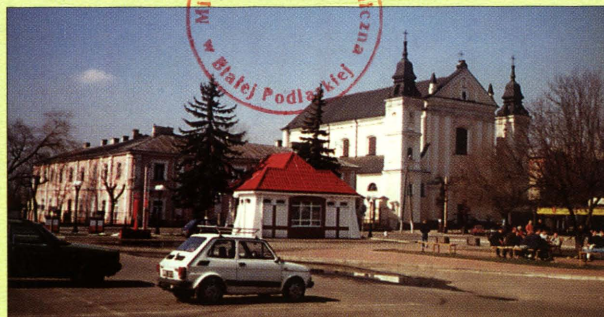
Centrum Janowa Podlaskiego