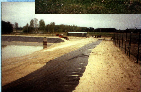
Oczyszczalnia ścieków w Kodniu