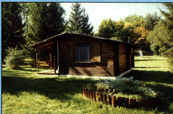
Ośrodek wypoczynkowy w Kodniu