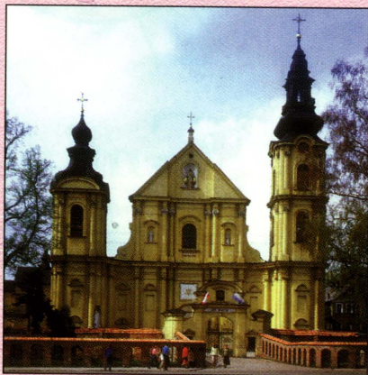
Kościół w Leśnej Podlaskiej

Gmina Leśna Podlaska położona w pasie nizin środkowopolskich, w makroregionie Nizina Południowo-podlaska nad rzeką Klukówką w południowej części Podlasia. Powierzchnia gminy wynosi 9769 ha, w tym użytki rolne 7740 ha. Lasy zajmują powierzchnię 1476 ha. W strukturze własności gruntów gospodarstwa indywidualne zajmują 81 % ogólnej powierzchni gminy. W 17 sołectwach o zwartej i kolonijnej zabudowie mieszka 4714 osób, z tego w wieku produkcyjnym 52%.