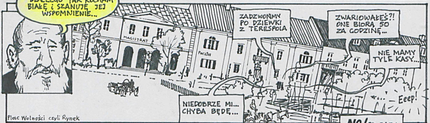
Plac Wolności czyli Rynek