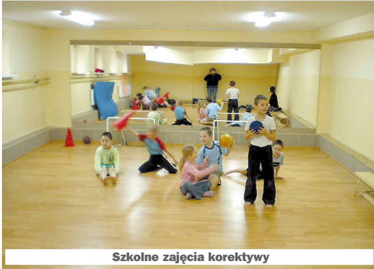
Szkolne zajęcia korektywy

Wykonane prace w znacznym stopniu poprawiły estetykę klasopracowni, korytarzy, pomieszczeń socjalnych i sanitariatów. Dokonana modernizacja obiektu szkolnego zapewni większe bezpieczeństwo 771 uczniom i 92 pracownikom szkoły. Jest także spełnieniem oczekiwań rodziców, którzy pragną, aby ich dzieci uczyły się w nowoczesnej, funkcjonalnej i pięknej szkole. Odnowione i