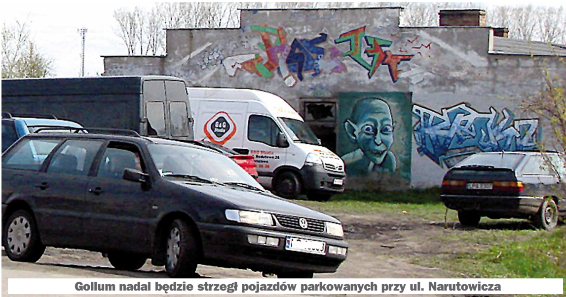
Gollum nadal będzie strzegł pojazdów parkowanych przy ul. Narutowicza