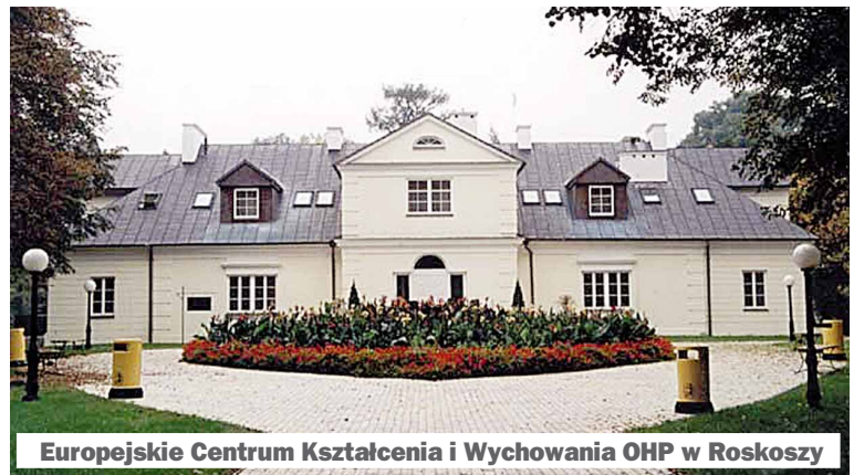
Europejskie Centrum Kształcenia i Wychowania OHP w Roskoszy

Uczniowie wszystkich białskich szkół, kończących się maturą, mogą przygotowywać się do egzaminu maturalnego na zajęciach pozalekcyjnych, tzw. „korepetycjach od prezydenta”. Tysiąc godzin zajęć zostało rozdzielonych proporcjonalnie między szkoły. Dziś pozostaje tylko się uczyć, tak więc: POŁAMANIA PIÓR!