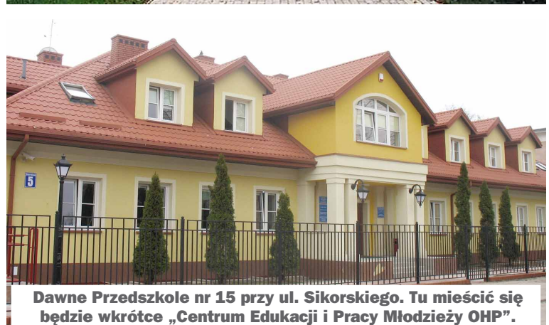
Dawne Przedszkole nr 15 przy ul. Sikorskiego. Tu mieścić się będzie wkrótce „Centrum Edukacji i Pracy Młodzieży OHP”.