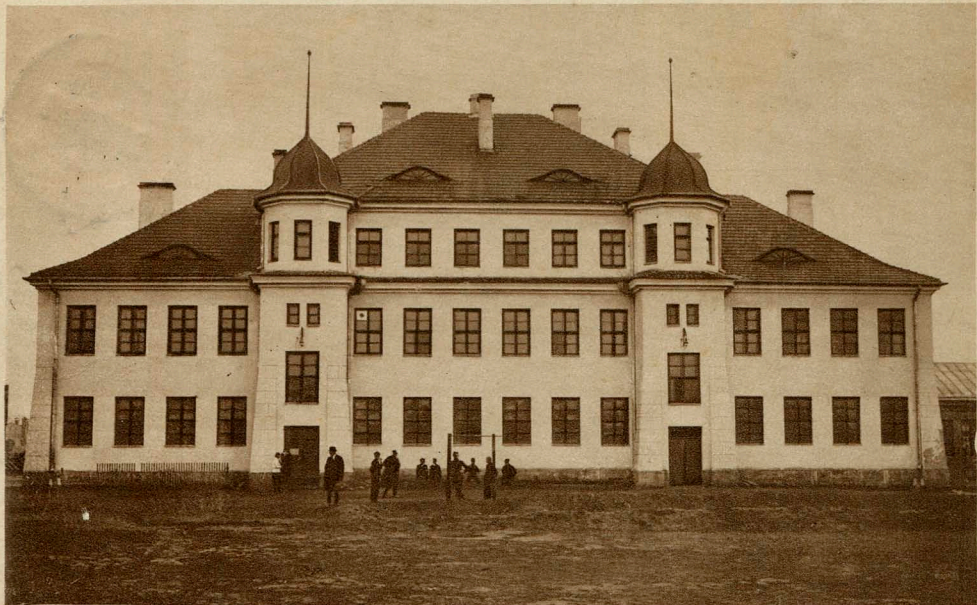
BRZEŚĆ n/B. Szkoła techniczna.