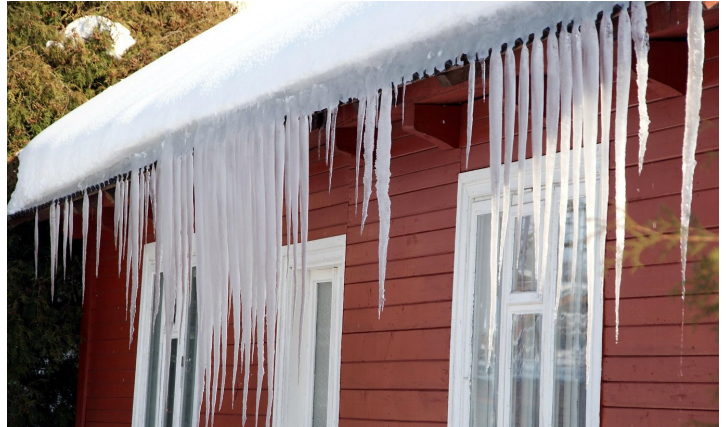
A zima trzyma...

Zebranie ŁSR podsumowujące kilkumiesięczny okres działalności nowego zarządu. Prezes ujawnia kolejne swoje pomysły: zorganizowanie w odnowionym łomaskim parku pikniku rodzinnego i festiwalu piosenki religijnej. Cóż, pożyjemy, zobaczymy. Podnosimy nakład biuletynu do 800 egzemplarzy.