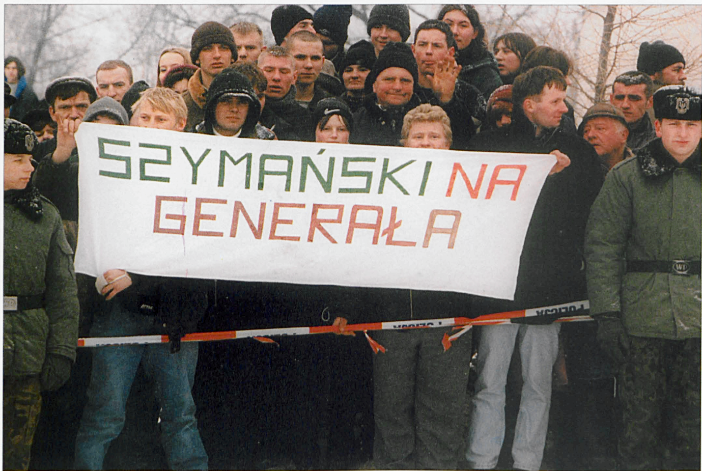
Przysięga w bialskiej jednostce wojskowej (marzec '99)