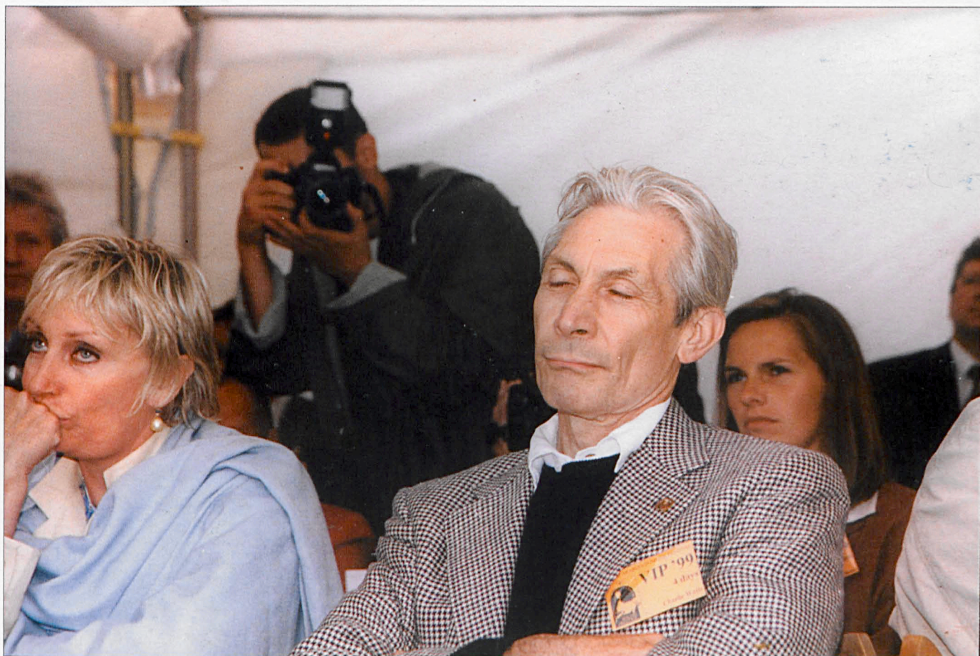
VIP - aukcja koni arabskich Charlie Watts (sierpień '99)