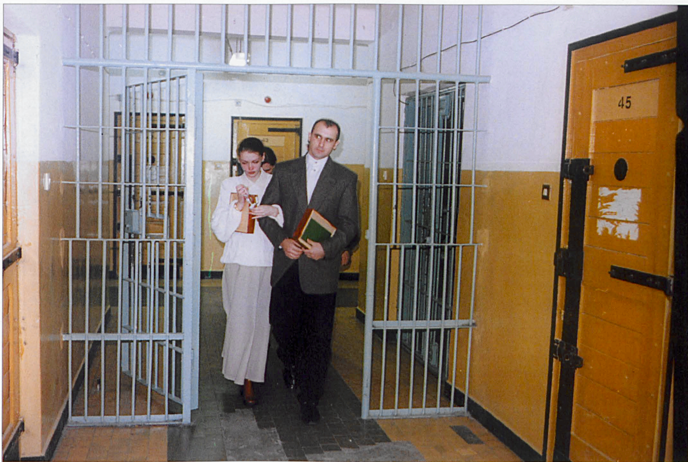
Ślub w białskim więzieniu (listopad '98)