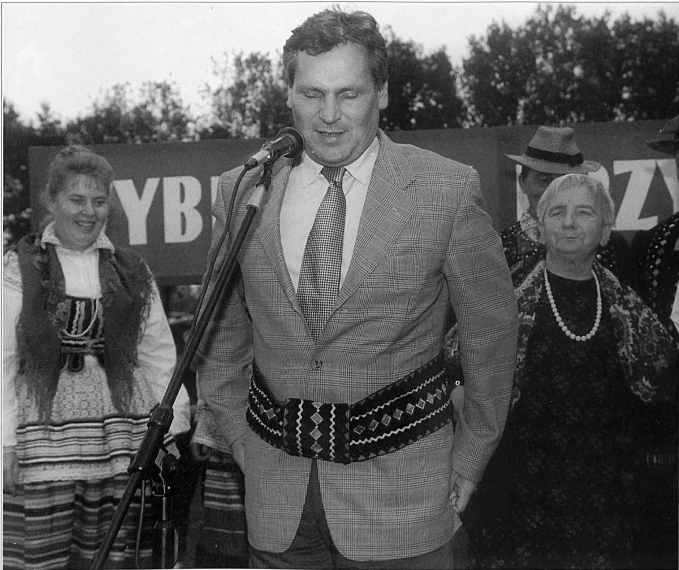
Przedwyborczy mitting Aleksandra Kwaśniewskiego w Parczewie (wrzesień '95)