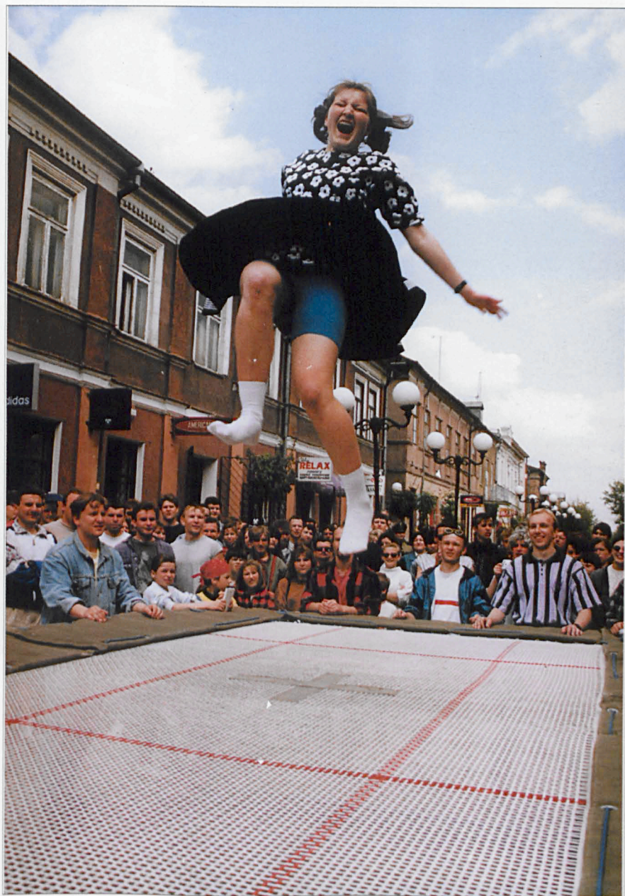
Juwenalia na Placu Wolności w Białej Podlaskiej (maj '97)