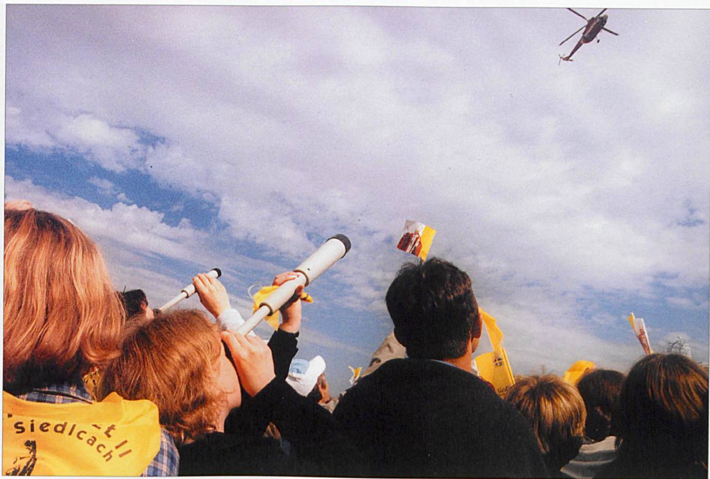
Przyłot papieża Jana Pawła II do Siedlec (10 czerwca '99)