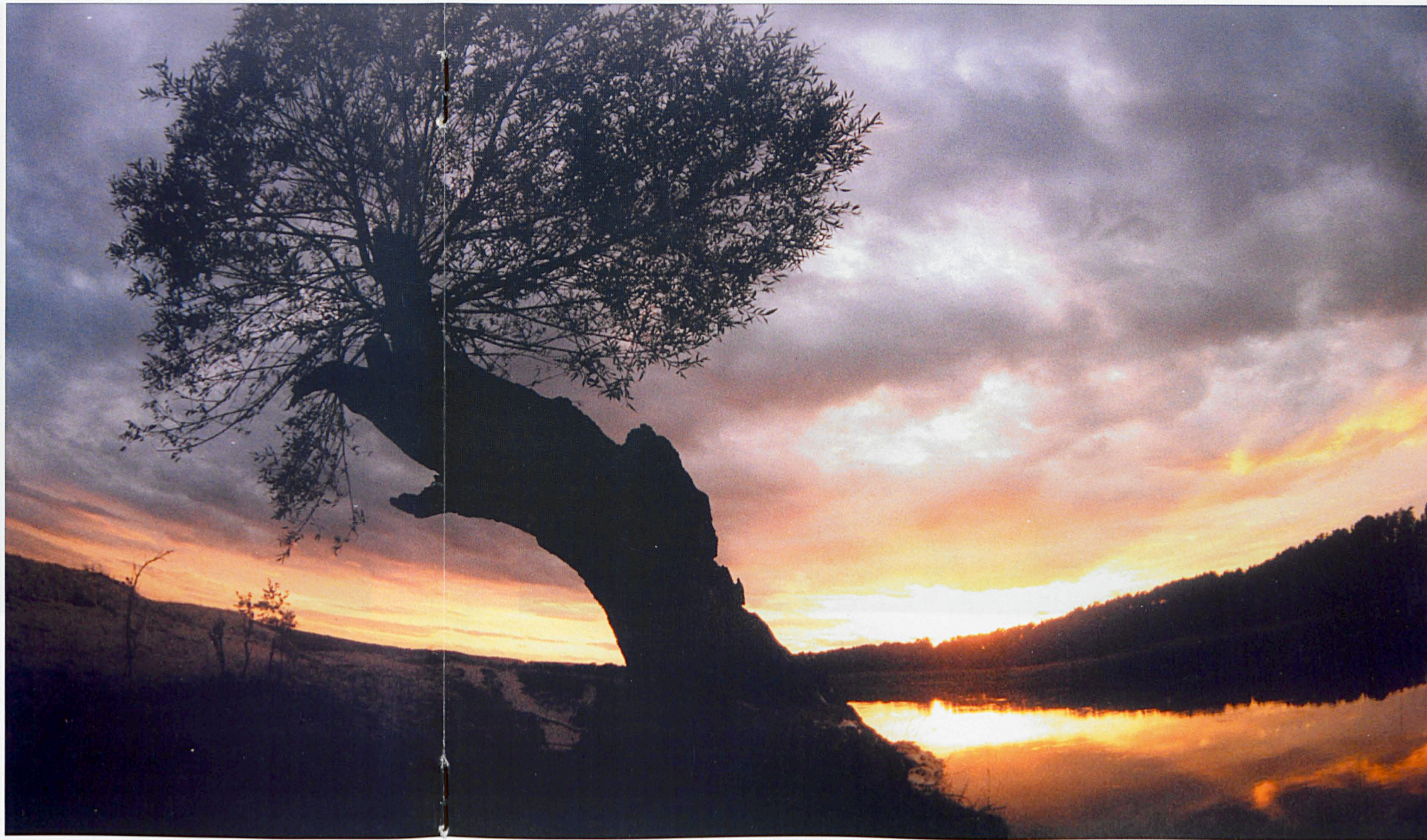
Bug w okolicach wsi Borsuki (wrzesień '97)