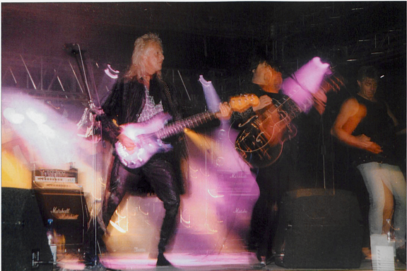
Koncert zespołu "The Sound of SMOKIE" w Białej Podlaskiej (sierpień '99)