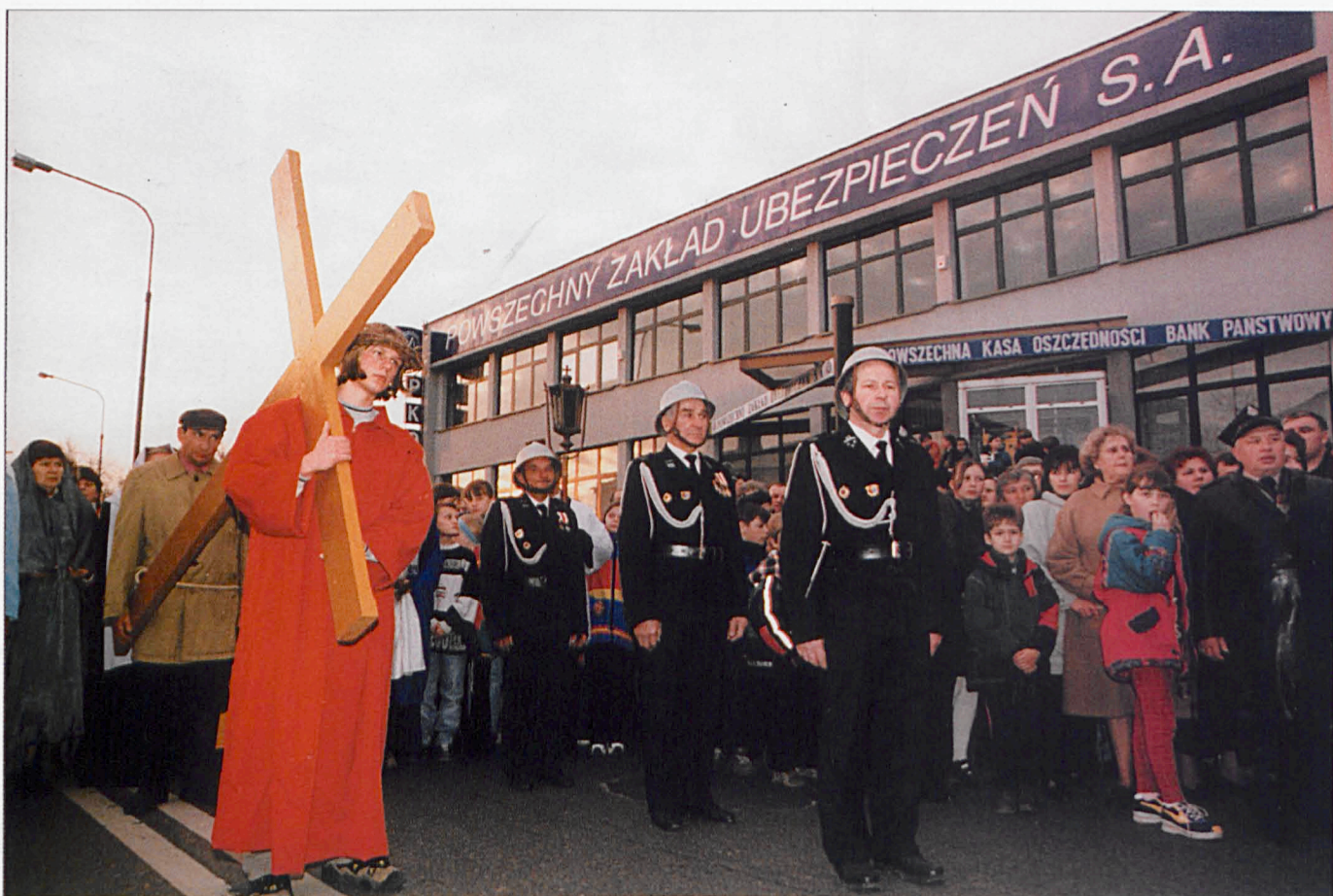
Misterium Niedzieli Palmowej w Łukowie (kwiecień '99)