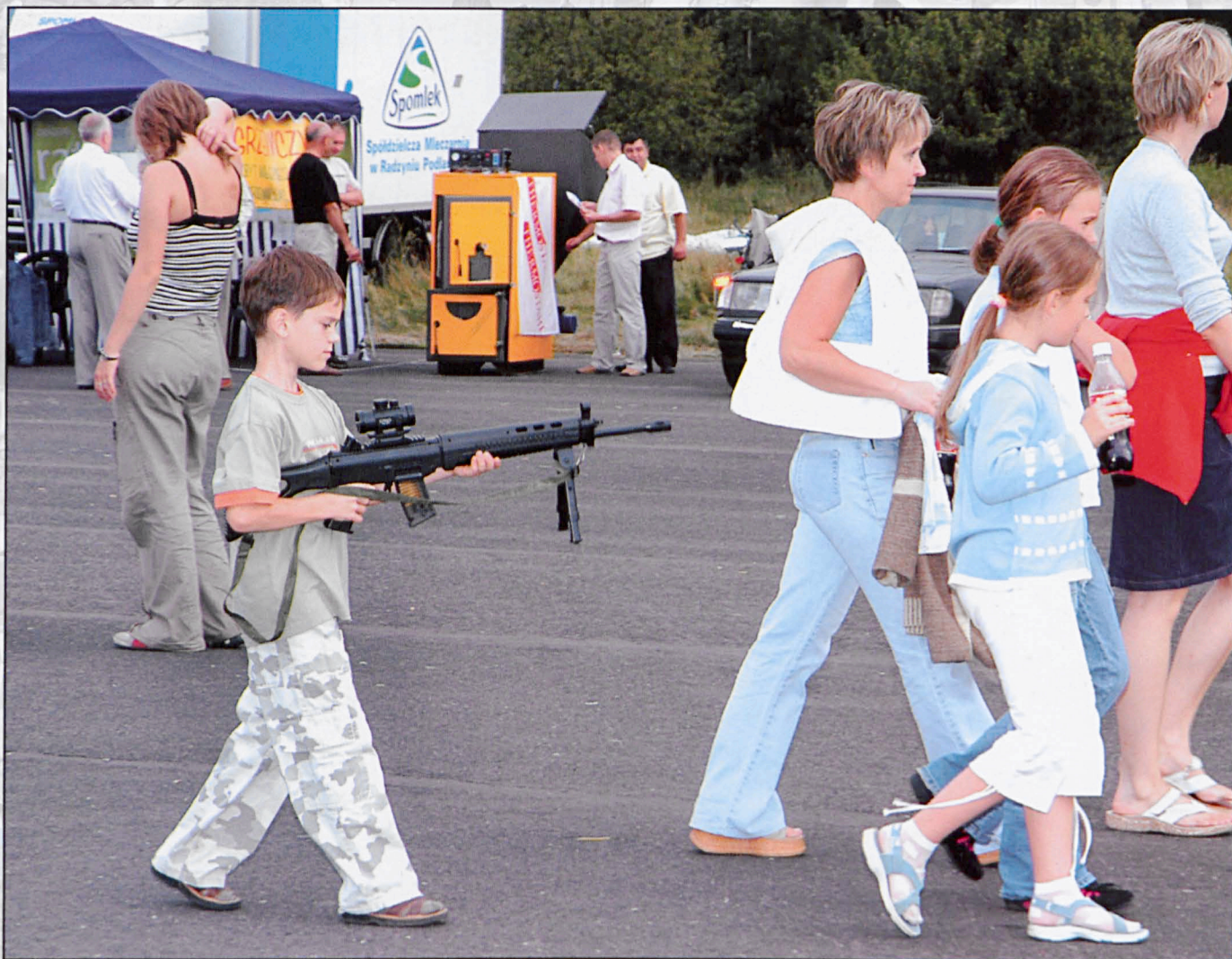
Biała Podlaska, sierpień 2005