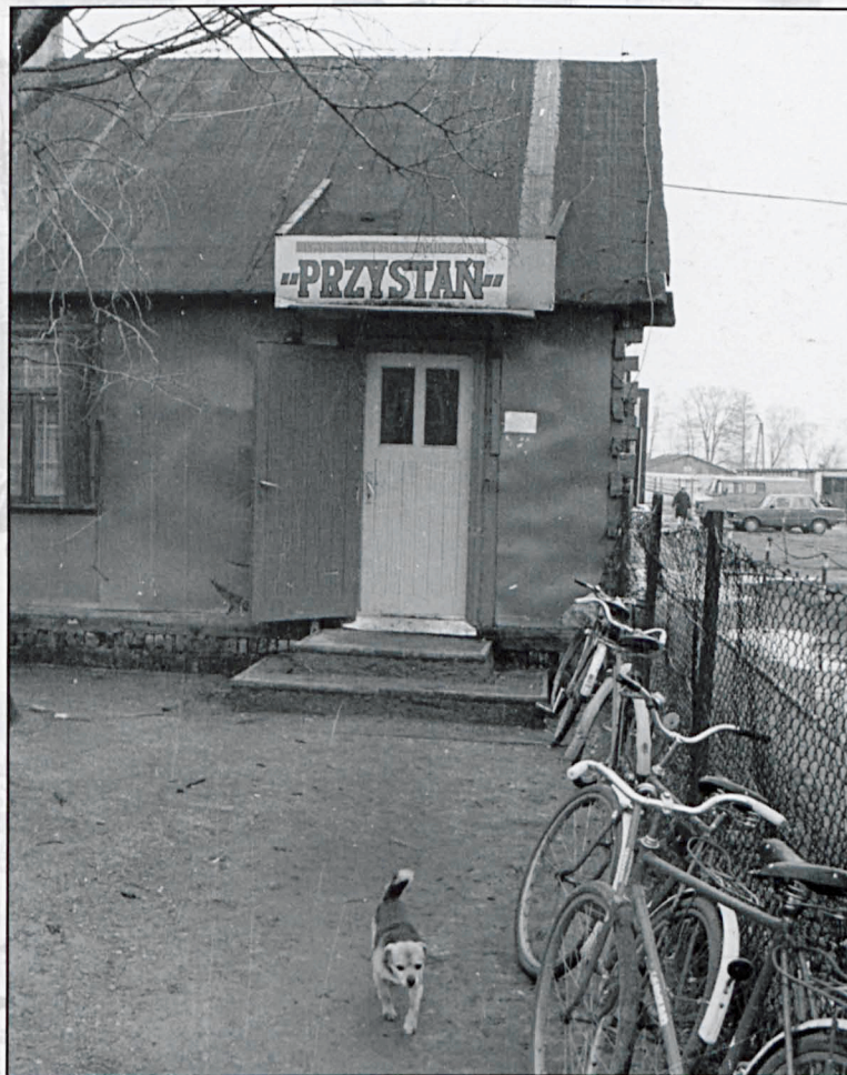
Drelów, listopad 1986