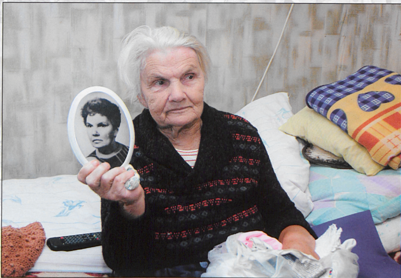
Jabłeczna, październik 2008