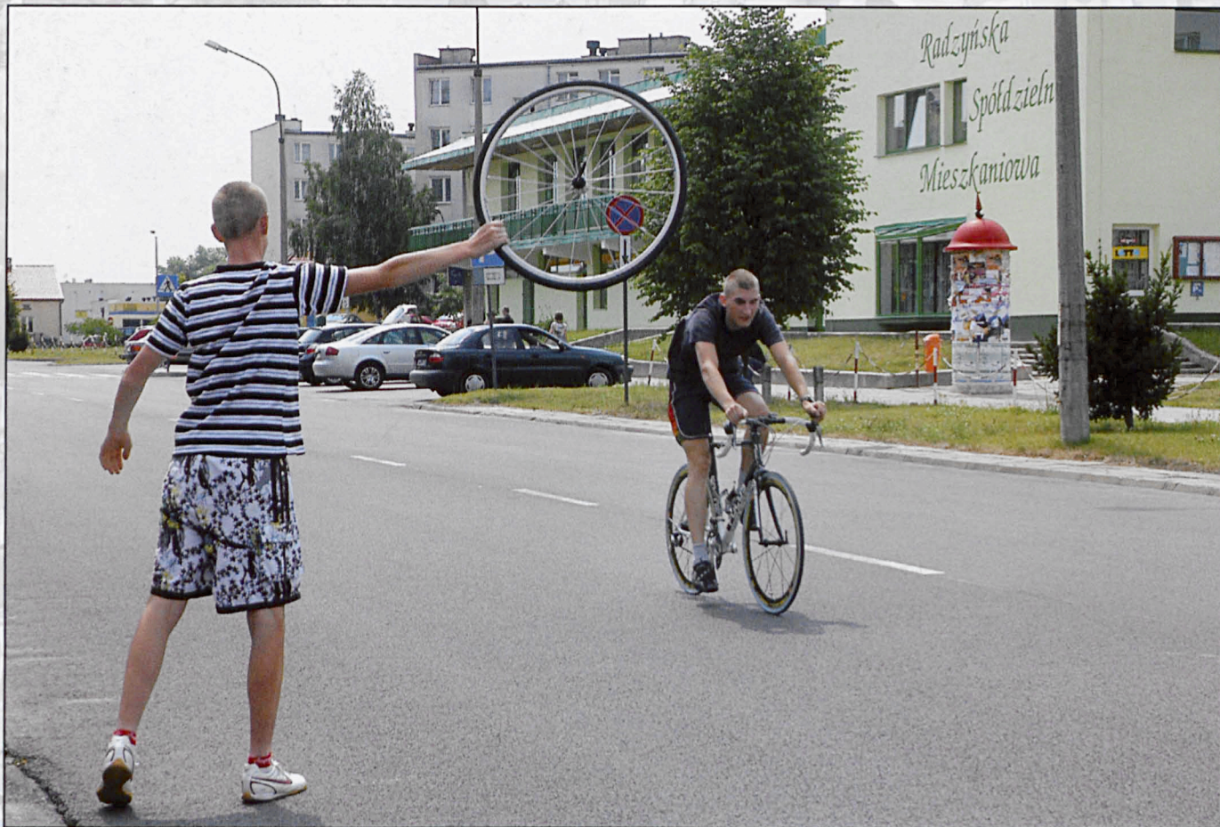
Radzyń Podlaski, lipiec 2008