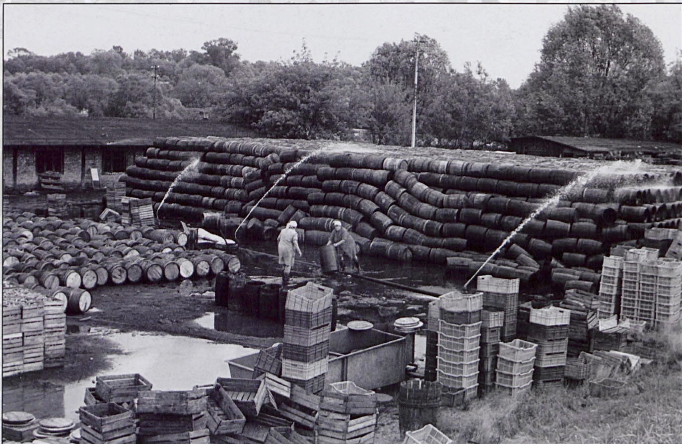
Terespol, lipiec 1980