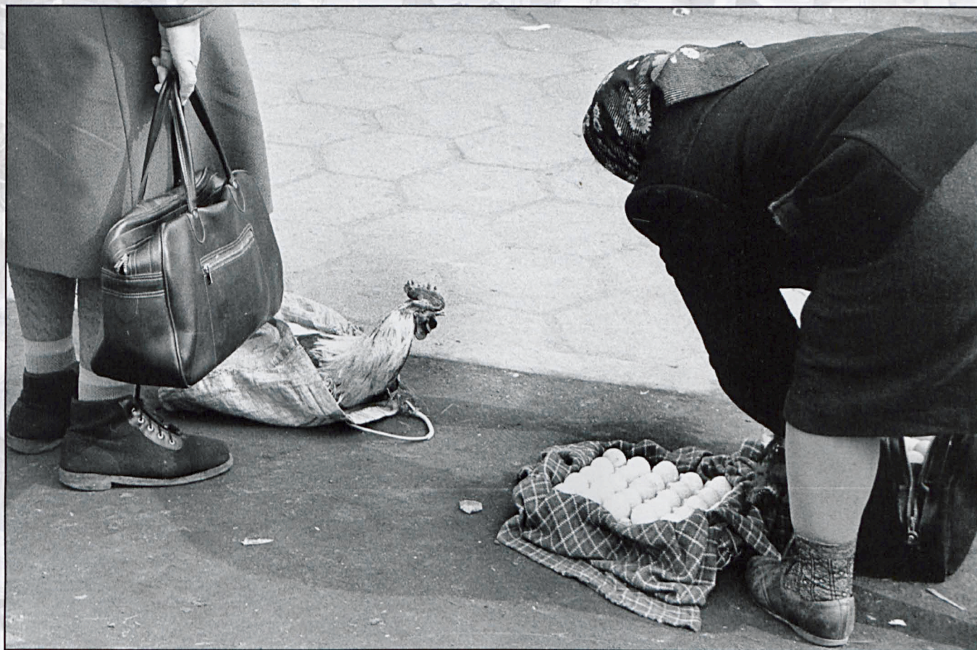
Białka Podlaska, kwiecień 1981