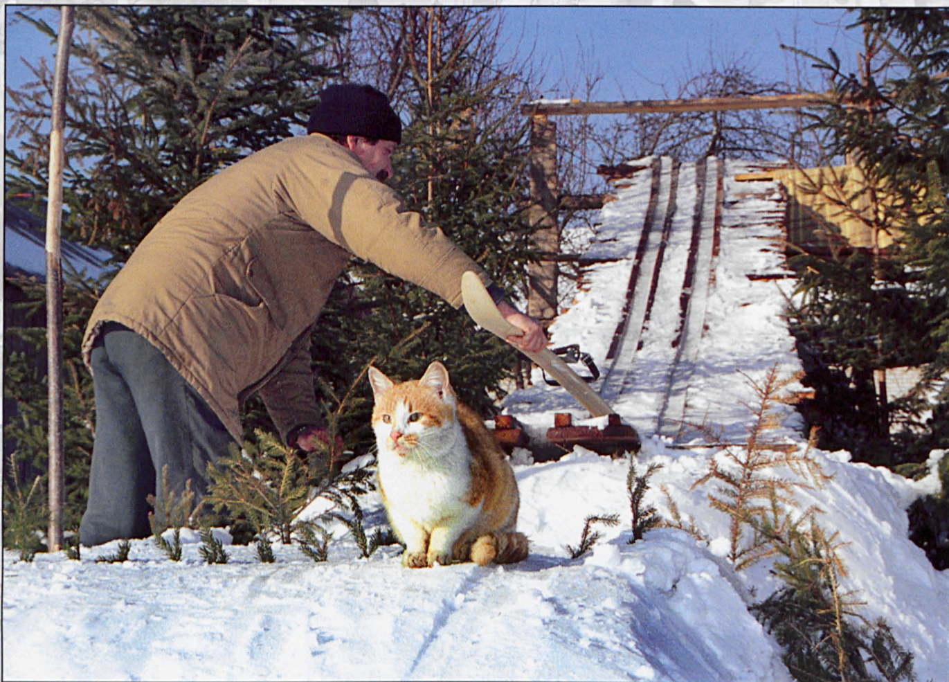
Szpaki, marzec 2005