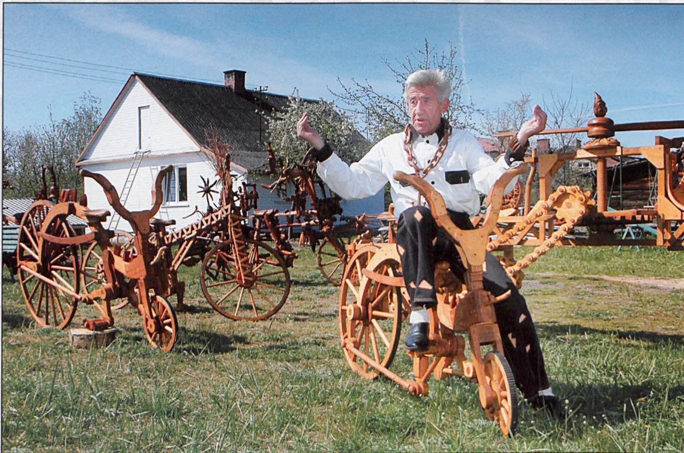
Biała Podlaska, maj 2007