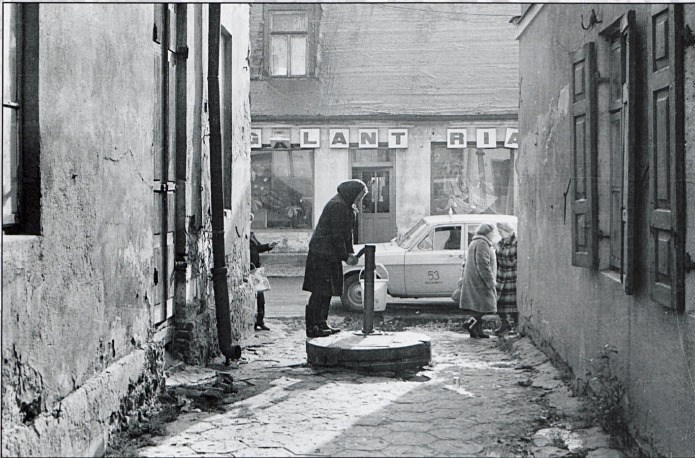
Biała Podlaska, marzec 1983