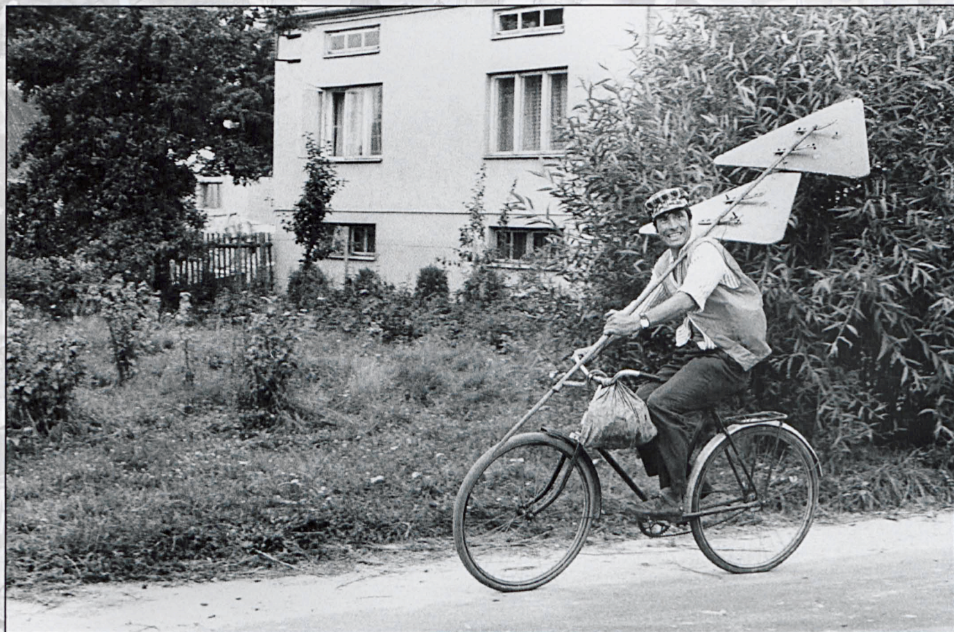
Bezwola, sierpień 1985