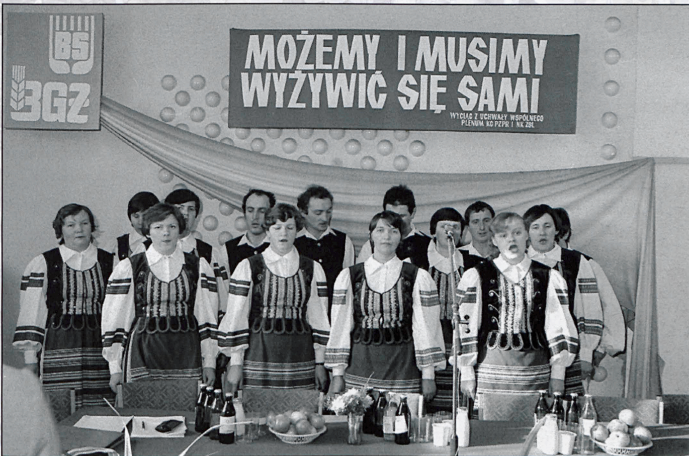
Biała Podlaska, luty 1983