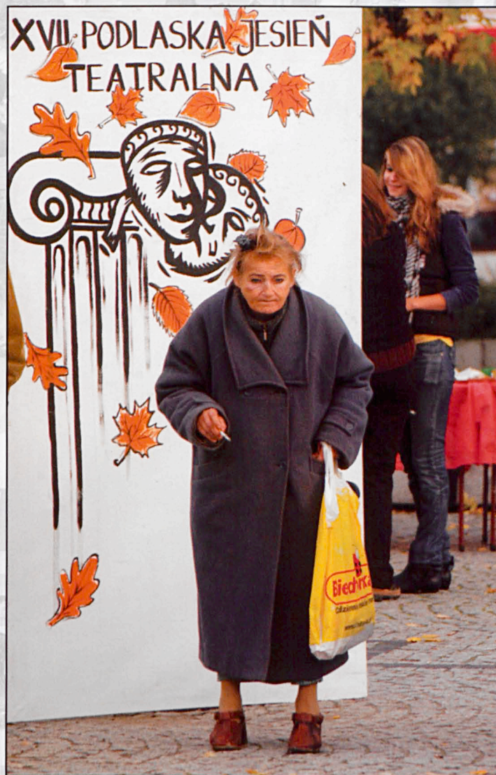
Biała Podlaska, wrzesień 2008