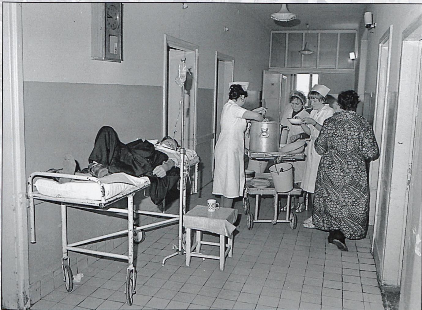
Biała Podlaska, październik 1984