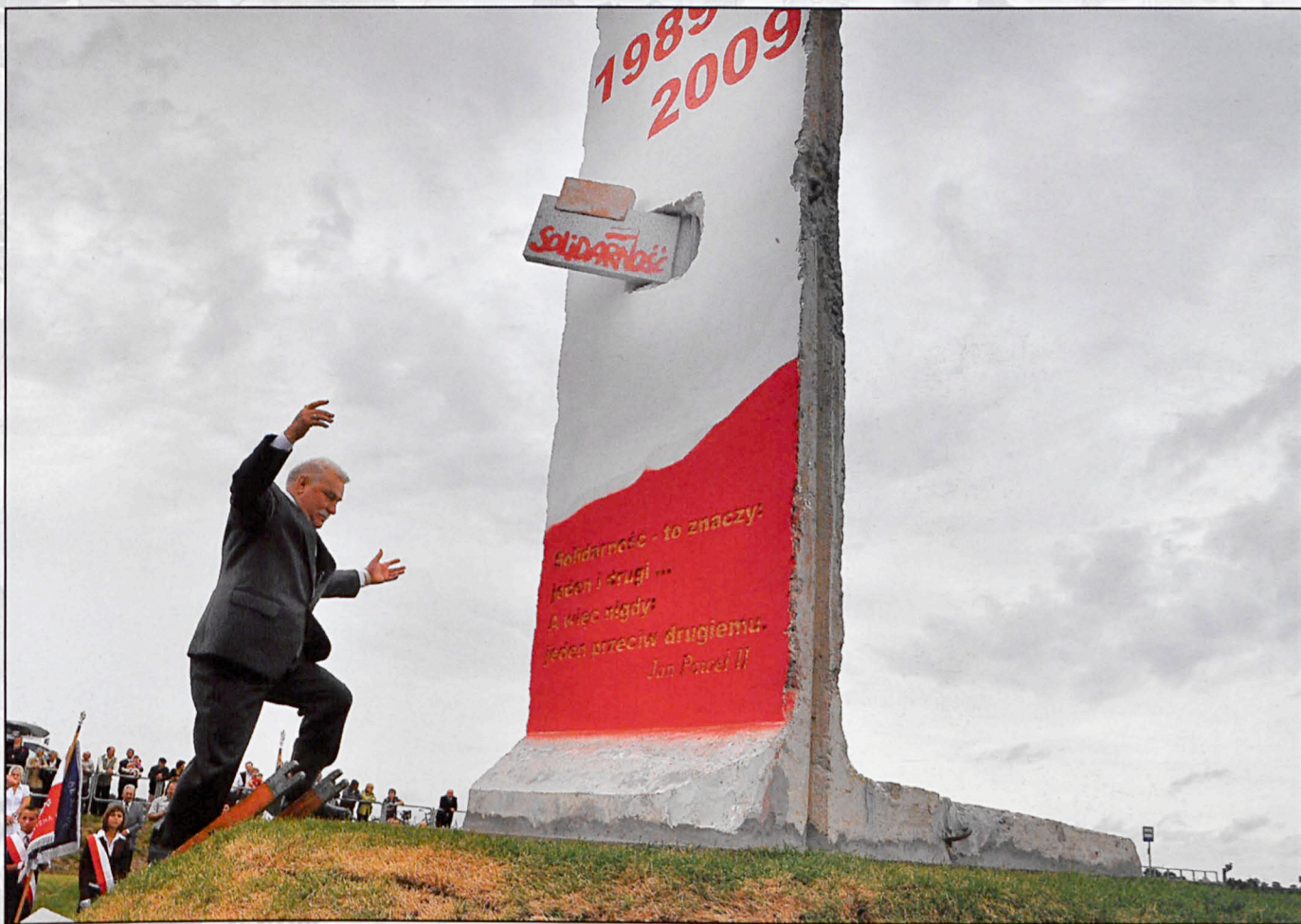
Kobylany, sierpień 2009