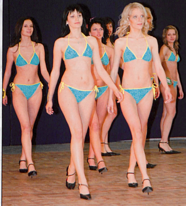
Biała Podlaska, czerwiec 2009

Serdeczne podziękowania dla redakcji tygodnika „Słowa Podlasia” za zrozumienie i pomoc przy realizacji wystawy