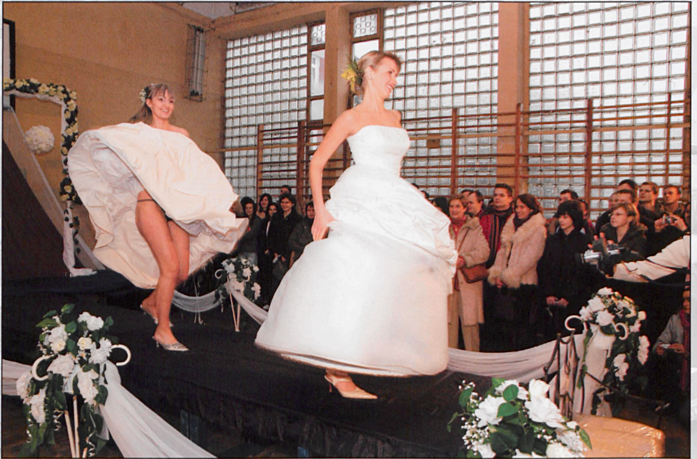
Biała Podlaska, luty 2006