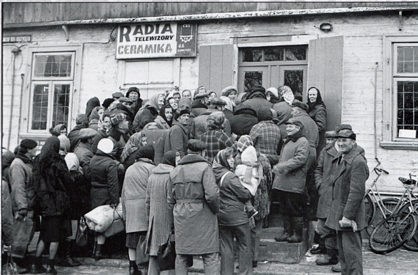
Sławatycze, listopad 1981