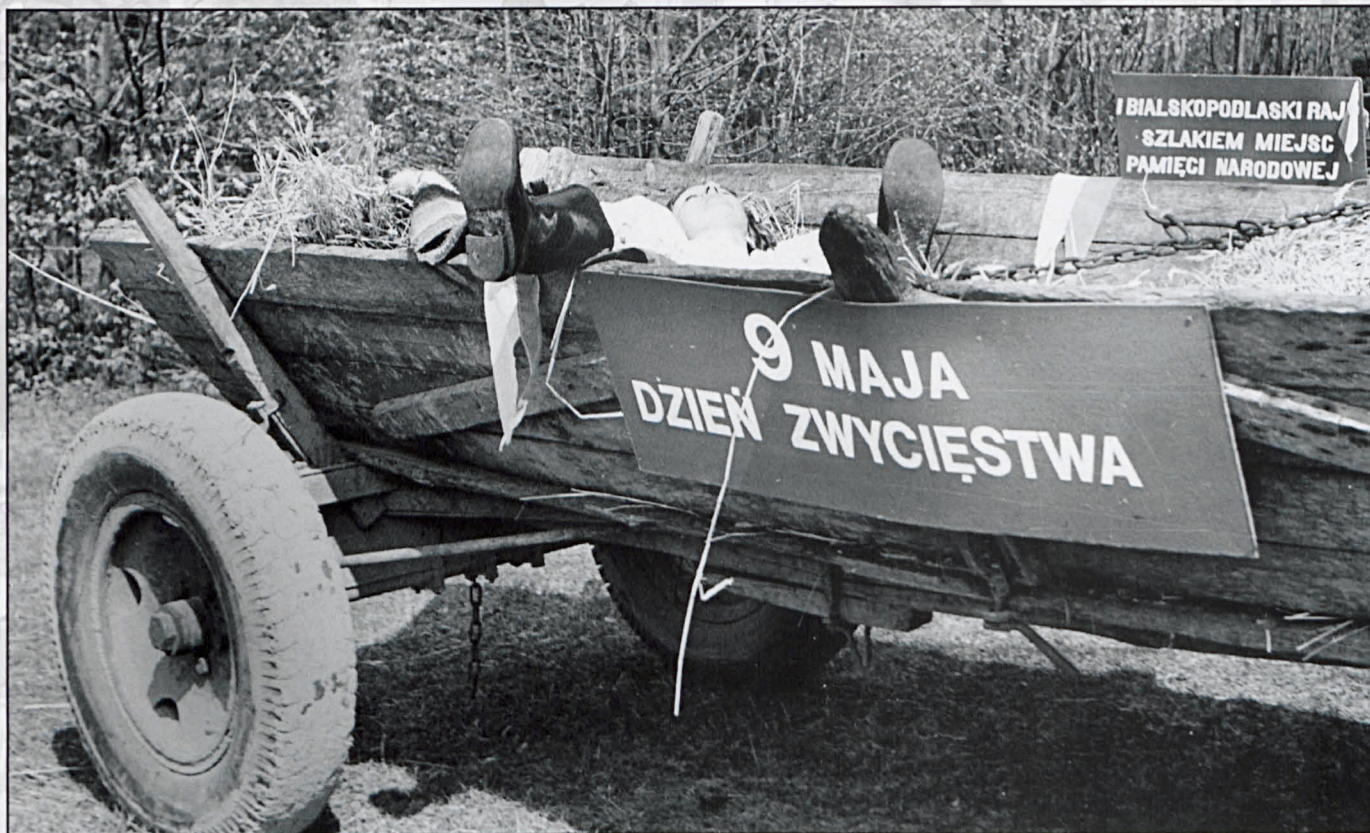
Grabarka k. Białej Podlaskiej, maj 1980