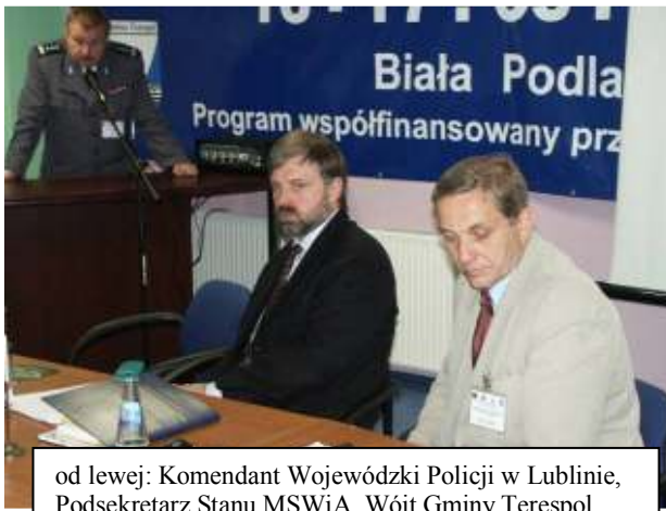
od lewej: Komendant Wojewódzkiej Policji w Lublinie, Podsekretarz Stanu MSWiA, Wójt Gminy Terespol

Europejskiej poprzez Euroregion Bug, dlatego też hasło przewodnie „Bug granicą Unii Europejskiej” było jak najbardziej aktualne.