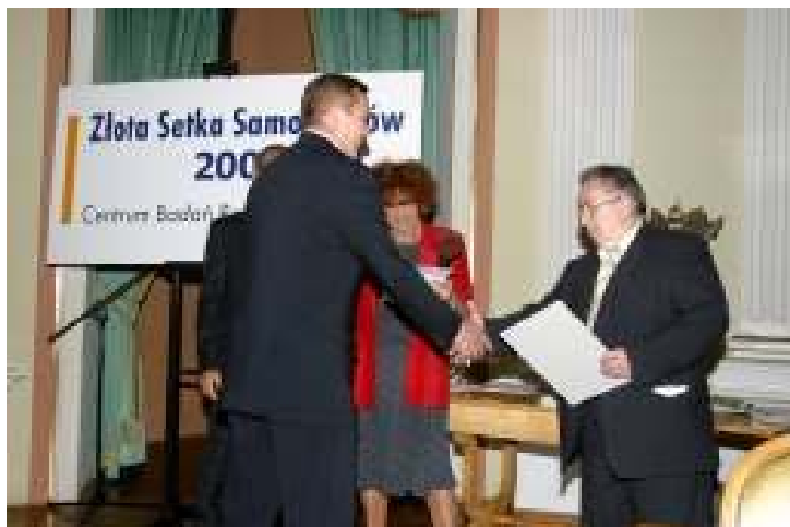
Laureatów odznaczyli: Prezes Centrum Badań Regionalnych – p. Wisła Surażska, Wicemarszałek Senatu – p. Kazimierz Kutz, Wicemarszałek Sejmu – p. Donald Tusk.

laureatów, gmina musiała przeznaczać na inwestycje co najmniej 30% swoich trzyletnich dochodów, a także utrzymać deficyt (bądź nadwyżkę) w granicach 25% swojego bilansu rocznego. Na Zamku Królewskim w Warszawie, 5 lipca, odbyło się uroczyste spotkanie na którym wręczono nagrody wszystkim laureatom. Nasza gmina po raz drugi znalazła się w złotej setce, na 89 miejscu spośród 2006 sklasyfikowanych gmin. W powiecie bialskim, wyróżniona została też Gmina Konstantynów, zajmując wysokie 49 miejsce w rankingu.