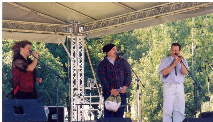
Kabaret „Szara Eminencja”