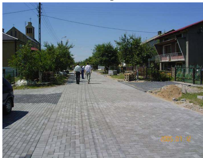
ul. Krótka - Małaszewicze