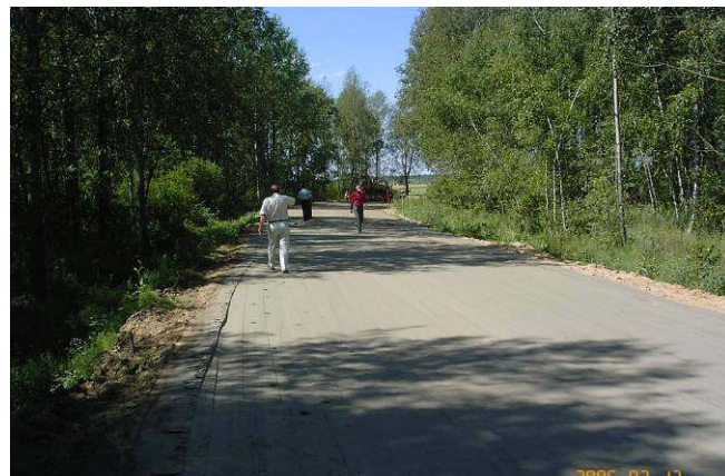
Droga gminna Kobylany-Lebiedziew