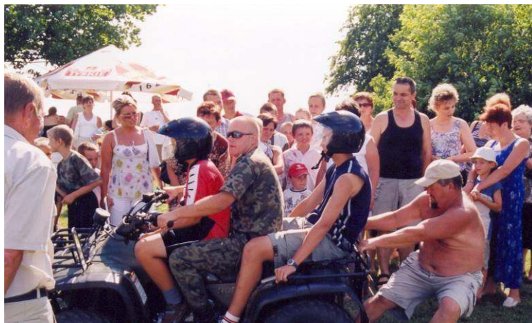
Pokazy Straży Granicznej Terespol