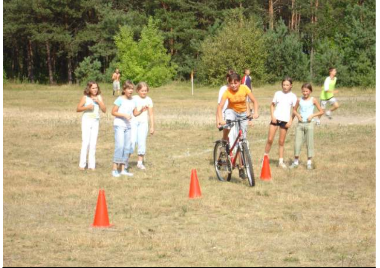
Nie zabrakło toru zręcznościowego dla cyklistów..

Organizatorzy składają serdeczne podziękowania firmie „Eko-Bug”, Ochotniczej Straży Pożarnej z Małaszewicz oraz firmie „Dolina Łąk”.