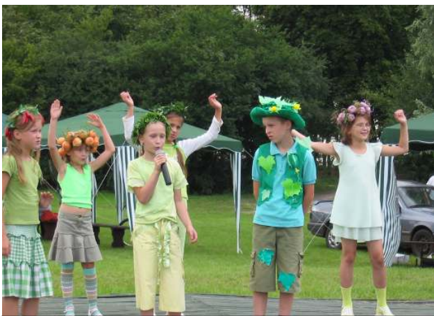
Występ dzieci z ZS im K. Makuszyńskiego w