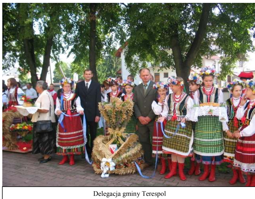
Delegacja gminy Terespol