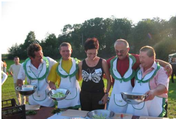
Męska obsada w konkursie na mizerię