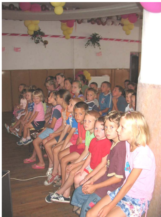
Pokaz filmowy w Łobaczewie Małym