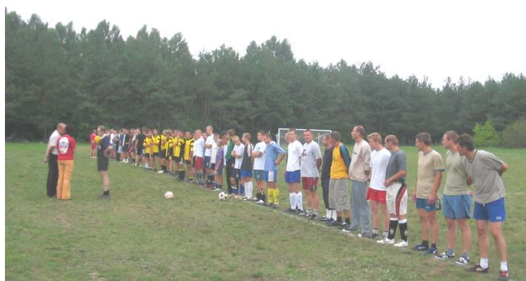
Zawodnicy przed rozgrywkami

Nagrody zostały ufundowane przez Gminny Ośrodek Kultury w Koroszczynie.