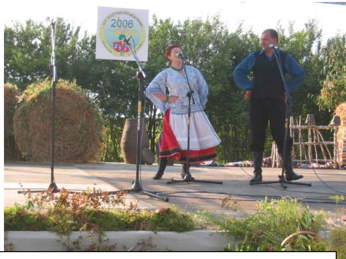
Występ zespołu „Sajgon Band”

Gminy Ośrodek Kultury w Koroszczynie składa