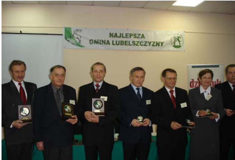
Przedstawiciele gminy Terespol podczas gali

Ranking został opracowany przez Związek Gmin Lubelszczyzny w oparciu o dane pozyskane z następujących