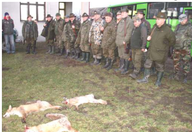
Pokot z polowania