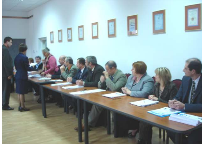
Nowa Rada Gminy Terespol podczas sesji