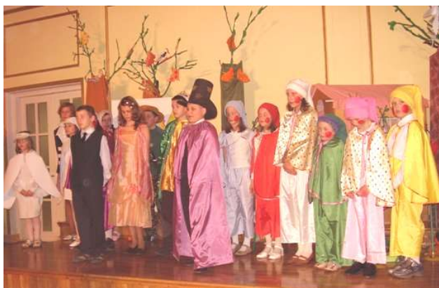
Grupa teatralna „Małe Liski”