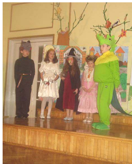
Grupa teatralna „Koziołeczki”