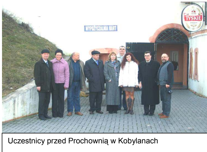
Uczestnicy przed Prochownią w Kobylanach