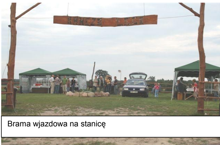
Brama wjazdowa na stanicę