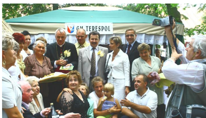
Wspólne zdjęcie przed stoiskiem Gminy Terespol

Niewątpliwym sukcesem zawdzięczamy pracy wszystkich osób zaangażowanych w przygotowanie inscenizacji stoiska, autorom rękodzieł artystycznych i twórcom prawie 60 smakołyków kulinarnych. Dużym zainteresowaniem wśród osób degustujących cieszyły się pyzy z mięsem i soczewicą, słoninka kobyłańska, smalczyk, zupa ogórkowa, ciasta, kwas chlebowy, wyroby wędliniarskie, pierogi i oczywiście ogórki kiszzone oraz wiele innych.