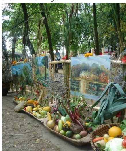
Fragment ekspozycji Gminy Terespol