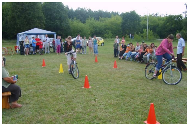
Zmagania w slalomie rowerowym

Uczestnicy Imprezy startowali w dwóch kategoriach: