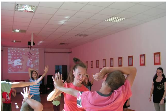
Zajęcia w GOK Koroszczyzn

Zawody rozgrywane były na trzech stołach tenisowych podzielone na trzy kategorie: szkoła podstawowa, gimnazjum, szkoła średnia. Mecze rozgrywane były systemem rosyjskim: „do dwóch przegranych”, po ośmiu zawodników w każdej kategorii.