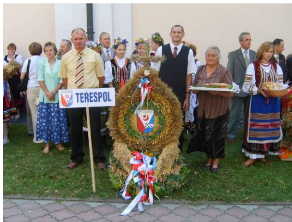
Delegacja Gminy z wieńcem dożynkowym