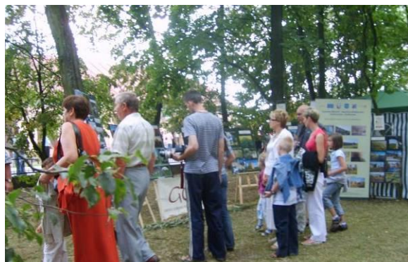
Wystawa fotograficzna „Gmina Terespol w obiektywie”.