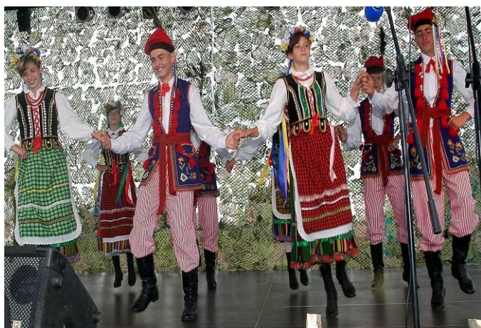
Podczas koncertu w Sławatyczach

Gminny Zespół Tańca Ludowego "Obertas" pracownicy wykorzystywał okres wakacji. Oprócz występu podczas Przeglądu folklorystycznego „Kultura bez granic” swoje taneczne zdolności zespół zaprezentował także podczas Impresji muzycznych w Janowie Podlaskim. Duże zainteresowanie swoim występem wzbudził podczas VI Powiatowego Spotkania z Piosenką Wakacyjną w Rokitnie.