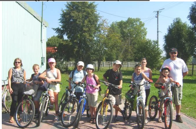
Uczestnicy wycieczki na starcie

Uczestnicy wycieczki spotkali się z rówieśnikami z Łęg i Bohukał na stacji „Ranczo Łęgi”. Czas spotkania minął przy ognisku kielbaskach oraz grach i zabawach sportowych. Podczas imprezy uczestnicy mieli okazję wysłuchać historii i legend związanych z odwiedzanymi miejscami. Organizatorzy przygotowali cztery trasy rowerowe o różnicowanym stopniu trudności, jednakże z powodu małej liczby chętnych odbyła się tylko jedna wycieczka.