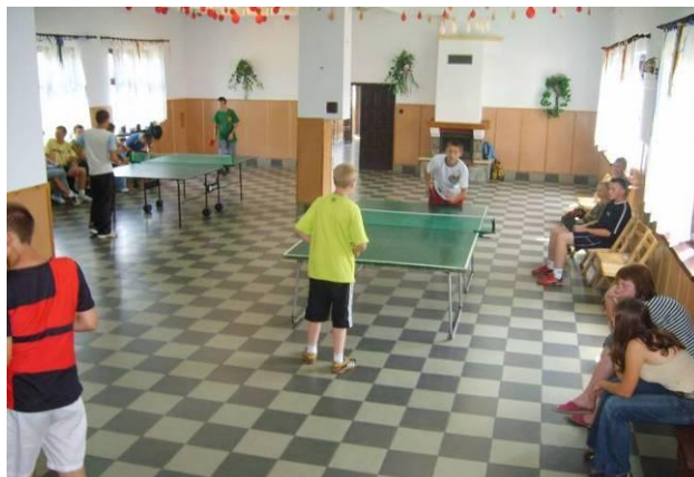
Uczestnicy turnieju podczas rozgrywek

Również tego samego dnia na boisku w Małaszewiczach Dużych odbyły się „Wakacje na sportowo” zorganizowane przez ULPKS, Lotnik Małaszewicze Duże” przy współpracy GOK Koroszczyn.