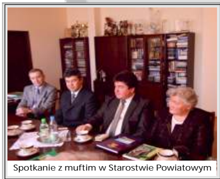
Spotkanie z muftim w Starostwie Powiatowym