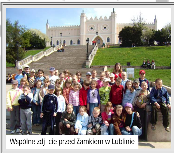
Wspólne zdjęcie przed Zamkiem w Lublinie