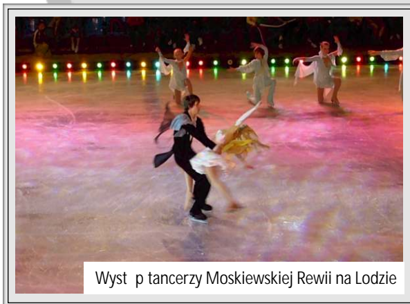
Występ tancerzy Moskiewskiej Rewii na Łódzie