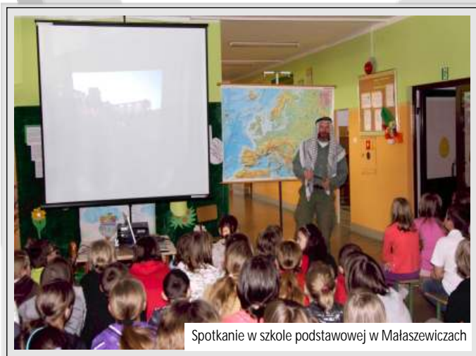
Spotkanie w szkole podstawowej w Małaszewiczach

Gminny Ośrodek Kultury w Koroszczynie, dzięki uprzejmości dyrekcji i grona pedagogicznego, do Zespołu Szkół im. Orła Białego w Kobylanach oraz Szkoły Podstawowej im. Kornela Makuszyńskiego w Małaszewiczach, 17 kwietnia zorganizował pokaz slajdów podróży niczych.