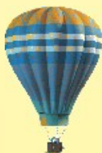
LOTY BALONEM NA UWIEZI