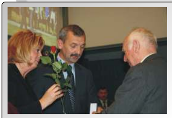
Zarząd Lubelskiego Okręgu Związku Nauczycielstwa Polskiego

ogłosił wyniki rankingu „Gmina przyjazna o wiacie i jej pracownikom”.