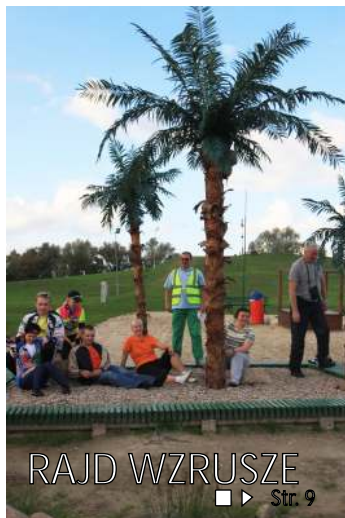
RAJD WZRUSZE ■▶ Str. 9