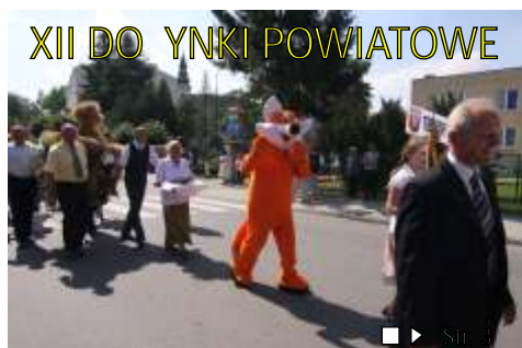
XII DOŚWIADKOWE POWIATOWE ■▶ Str. 3