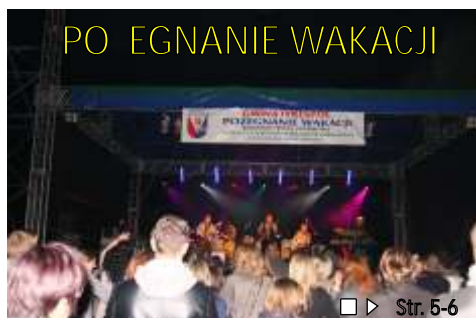
PO WROTA WAKACJI ■▶ Str. 5-6