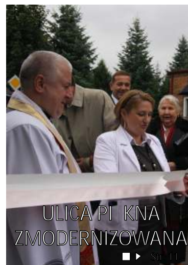
ULICA PI KNA ZMODERNIZOWANA ■▶ Str. 11