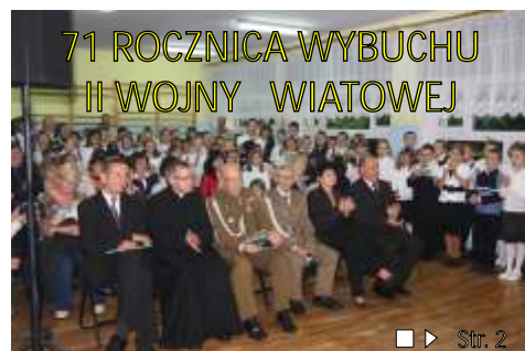
71 ROCZNICA WYBUCHU II WOJNY ŚWIATOWEJ ■▶ Str. 2