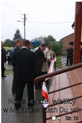
Nowe oblicze wiośnicy w Malaszewiczach Dużych ■▶ Str. 10