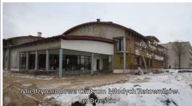
Międzynarodowe Centrum Młodych Ratowników w Brześciu

W dniach 9-10 grudnia 2010r. w Brześciu na Białorusi odbyło się spotkanie podsumowujące projekt pt. „Nowoczesne systemy społecznego uczestnictwa w zapobieganiu i likwidacji ekologicznych katastrof w Euroregionie Bug” w ramach Programu Sąsiedztwa Polska Białoruś Ukraina INTERREG IIIA/TACIS CBC. Delegacje z Ukrainy, Litwy, Niemiec i Polski miały okazję zapoznać się z funkcjonowaniem Straży Pożarnej oraz zobaczyć trwającą budowę Międzynarodowego Centrum Młodych Ratowników Strażaków w Brześciu.