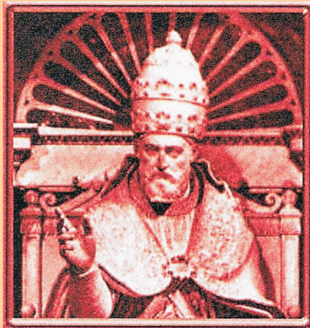
Papież Klemens VIII był gorącym orędownikiem unii Cerkwi prawosławnej z Kościołem rzymsko-katolickim

Hipacy Pocij przed podjęciem służby Bożej nosił imię Adam Lwowicz. Urodził się 12 kwietnia 1541 roku we wsi Różanka koło Włodawy, wówczas w pow. brzeskim (zmarł w 1613 roku). Absolwent Akademii Krakowskiej, wywodzący się z możnego i ważnego na Litwie rodu Pocijów, został sekretarzem króla Zygmunta Augusta. W latach 1580 - 89 pełnił funkcje sędziego ziemskiego brzeskiego, po czym awansował