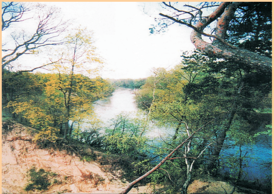
Rzeka Bug płynie dziś jak przed wiekami

Włodzimierzu Wołyńskim, skąd spławiali Bugiem do Narwi i swoich siedzib, narażając się po drodze na normalne w tamtych czasach niebezpieczeństwa.