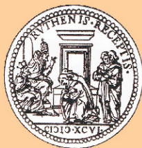
Medal wybitny w Watykanie z okazji Unii Brzeskiej

W tym samym dniu papież ogłosił bulę „Magnus Dominus et laudabilis nimis” informując świat o przystąpieniu Rusinów do unii z Rzymem. Pocij przywiózł z podróży do papieża ikonę Matki Bożej, znajdującą się dziś w kościele pw. Podwyższenia Krzyża Św. w Brześciu i uznawaną od wieków za cudowny obraz Matki Bożej Brzeskiej.