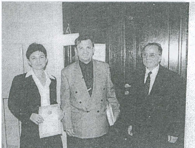
Przedstawiciele gminy Terespol w towarzystwie ministra Krzysztofa Szamałka w chwilę po wręczeniu nominacji.