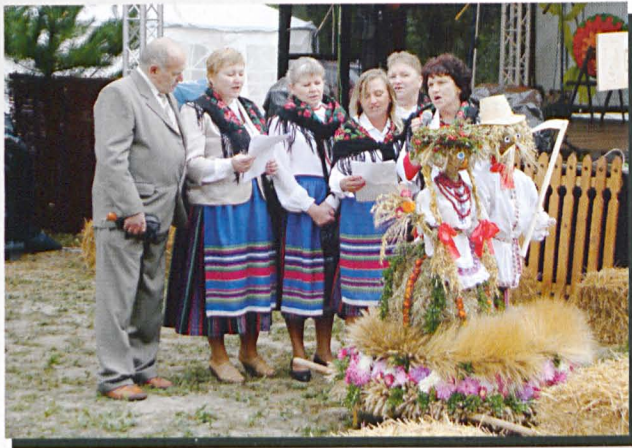
Reprezentacja gospodarzy z Grabanowa