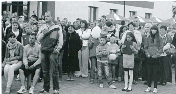
Na dożynkach zjawilo się wiele osób

Z udziałem dziesięciu zawodników rozegrany został emocjonujący kon-