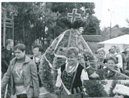
Najpiękniejszy wieniec tradycyjny z Sitnika i Łukowców