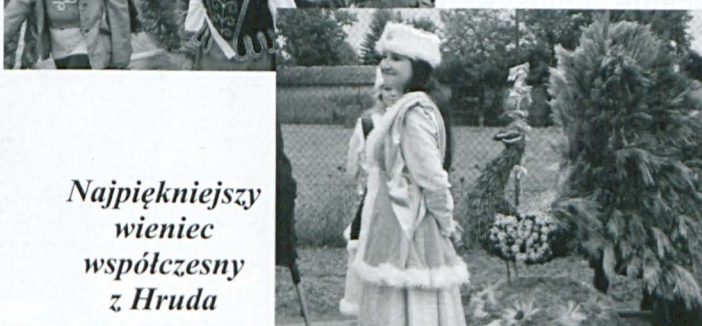
Najpiękniejszy wieniec współczesny z Hruda