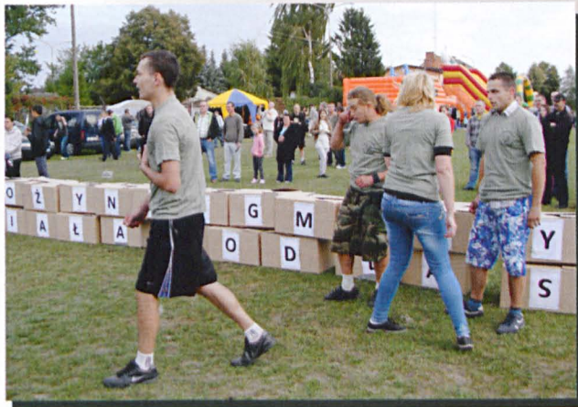
Układanie paczek z napisami