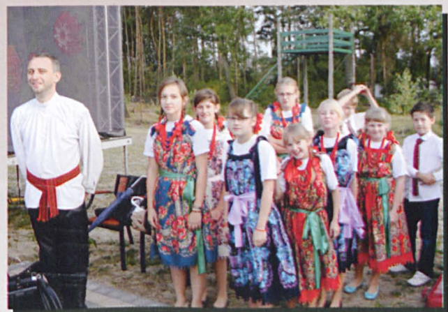
Wrzoski z Woskrzenic Dużych