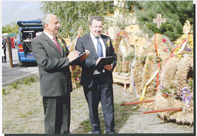
Komisja jurorska przy pracy