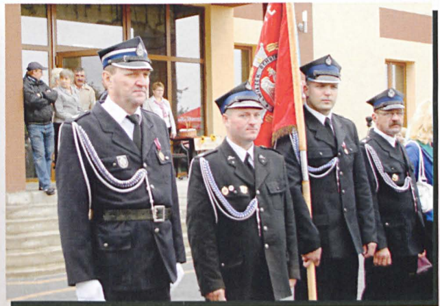
Sztandar Zarządu Gminnego ZOSP