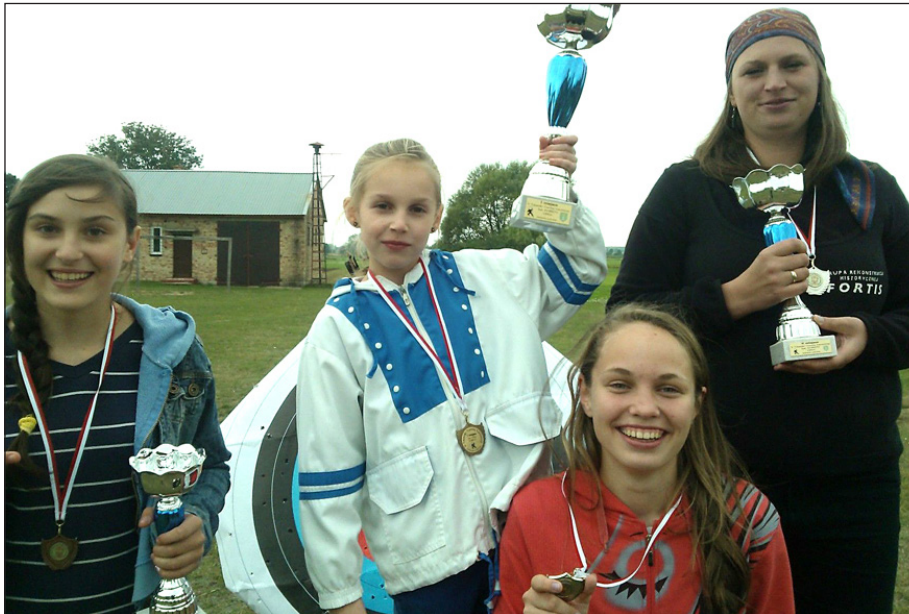
Rywalizacja kobiet w turnieju łuczniczym była zacięta.