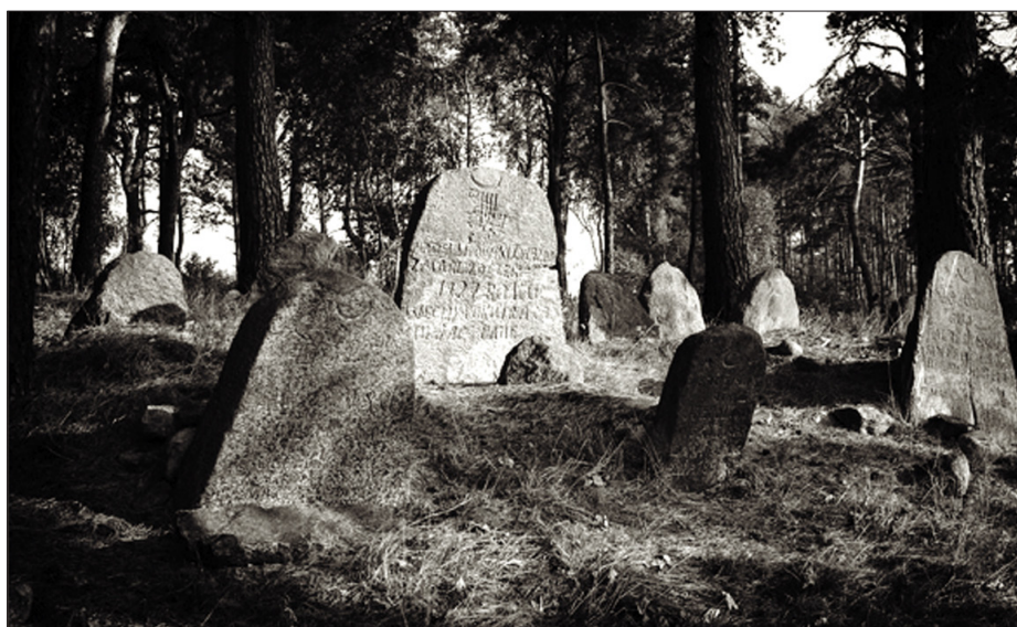
Miziar w Studziance od strony rzeki Zielawa.

Ważne, aby przeszłość szanować i utrzymywać, choćby przez stare zdjęcia, wspomnienia, pamiątki rodzinne, które składają się na wspólne narodowe bogactwo. Ważne, aby miejsca, które nosimy w swoich sercach, nawet gdy jesteśmy od nich daleko, nie zniknęły wraz z naszym przemijaniem. Bo to, co jest nieuchronne, to na pewno przemijanie. Kiedy ktoś umiera, wraz z nim bezpowrotnie odchodzi pewna historia, a często też złożone losy. Może warto czasami porozmawiać ze starszymi osobami, które codziennie mijamy, a są dla nas obojętne i anonimowe. Na pewno jeśli uczynimy ten pierwszy krok, okażą nam swoją bezinteresowność i poświęcą chwilę