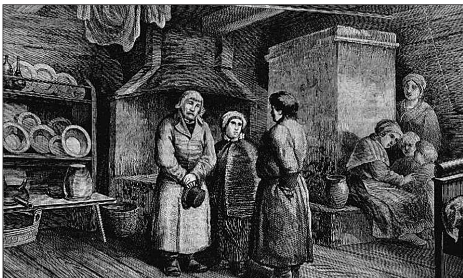
Wnętrze wiejskiej chaty. Rys. Józefa Polkowskiego.