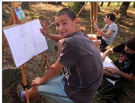
Plener malarski.

dzianka” ze środków Urzędu Gminy Łomazy. Naukę rysowania, warsztat malowania w terenie poprowadziła artysta-plastyk Anna Bandzarewicz.