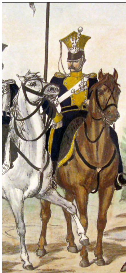
Ułan 3 Pułku Ułanów Królestwa Kongresowego.