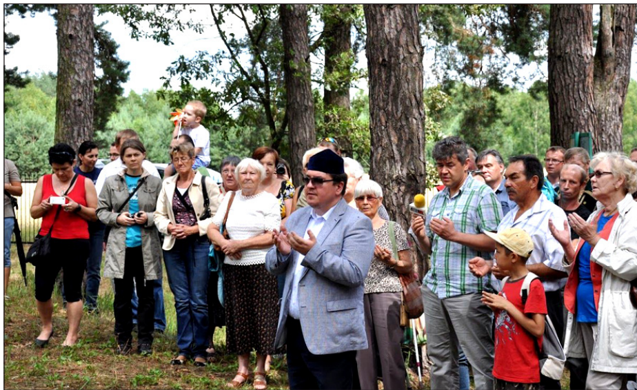
Modlitwa na mizarze.

biegu. Każdy z zawodników otrzymał numer startowy, który należało zaczepić. W biegu na 400 m wygrał zdecydowanie Dawid Waśkiewicz z Łomaz.