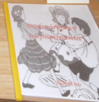
Gminna Biblioteka Publiczna w Rokitzku