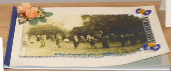
Gminna Biblioteka Publiczna w Nowatyczach