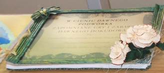
Pała Gminna Biblioteka Publiczna w Działdowie