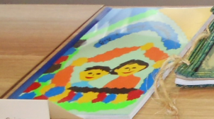
Gminna Biblioteka Publiczna w Łobży Polickiej