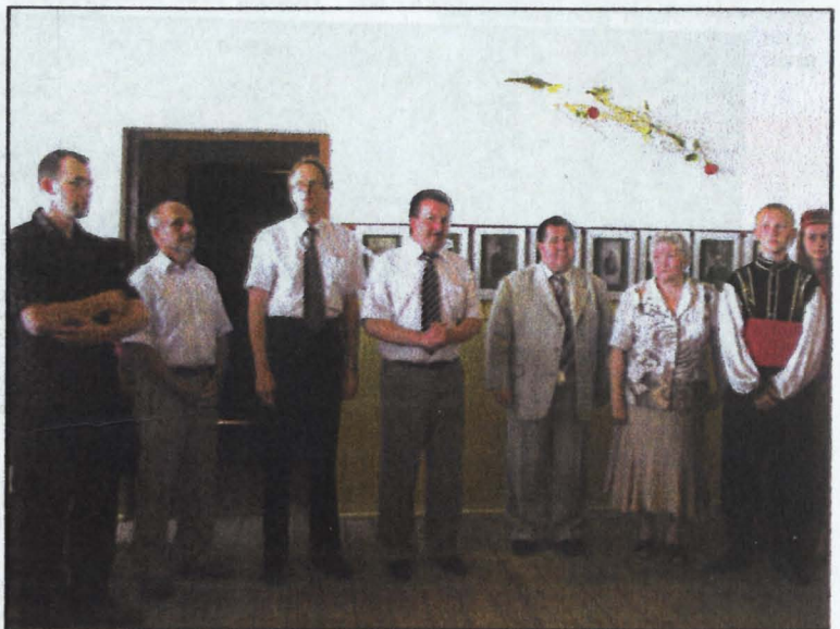
Otwarcie wystawy poświęconej Tatarom okolic Studzianki.