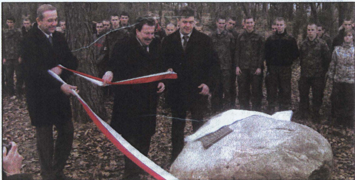
Moment odsłonięcia pamiątkowej tablicy