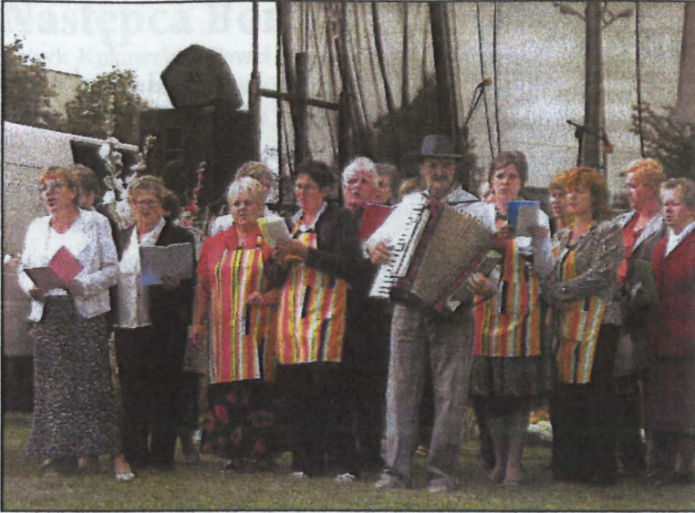
Rozśpiewani mieszkańcy Studzianki na dożynkach gminnych w Łomazach

w Lublinie. Warto dodać, że do stolicy województwa pojechał autokar mieszkańców - kibiców.