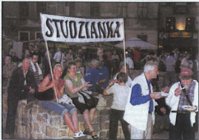
Reprezentacja Studzianki na Europejskim Festiwalu Smaków w Lublinie

Warto podkreślić że sierpień i wrzesień ubiegłego roku były wyjątkowym czasem w działalności stowarzyszenia. W ramach realizowanego projektu Letnia Akademia Wiedzy o Tatarach odbył się dwudniowy festyn Dni Kultury Tatarskiej w Studziance. Ponadto, zainteresowanie wzbudził Tatarski Turniej Rodzin-