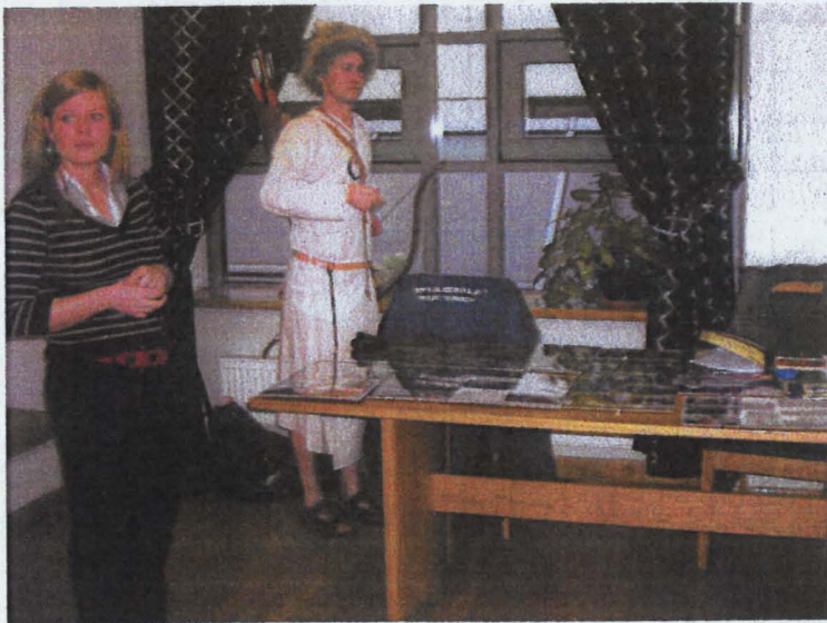
Nasze stoisko promocyjne.