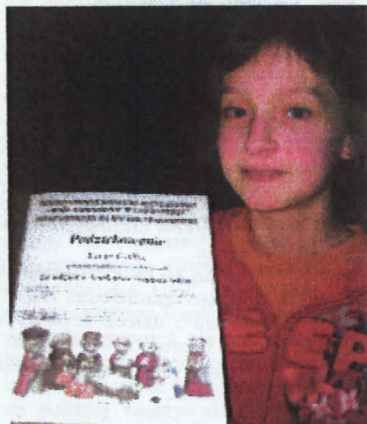
Laureatka nie kryje radości z wyróżnienia

Mieszka w Studziance i jest uczennicą VI klasy Szkoły Podstawowej w Łomazach. Na konkurs recytatorski została wybrana po zajęciu drugiego miejsca w etapie szkolnym.