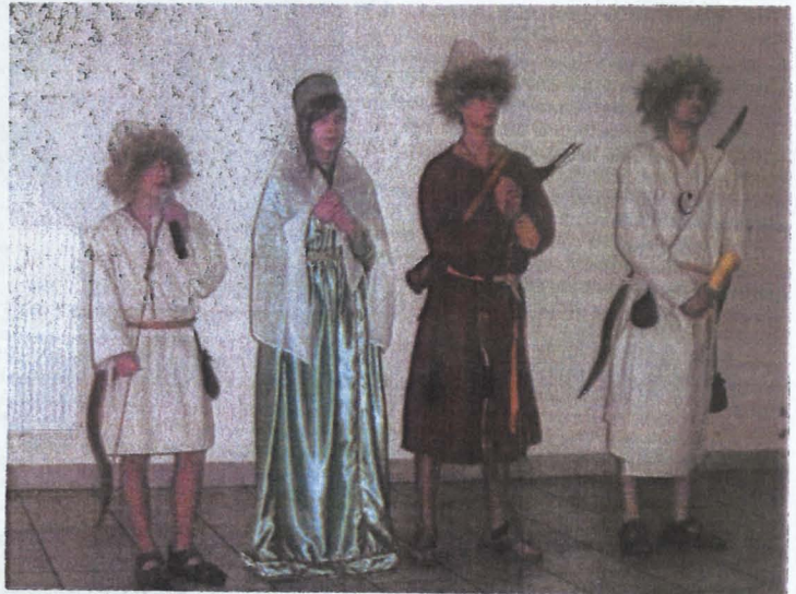
Członkowie stowarzyszenia w czasie prezentacji.