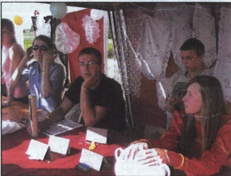
Stoisko promocyjne Studzianki na Dniach Kultury Tatarskiej