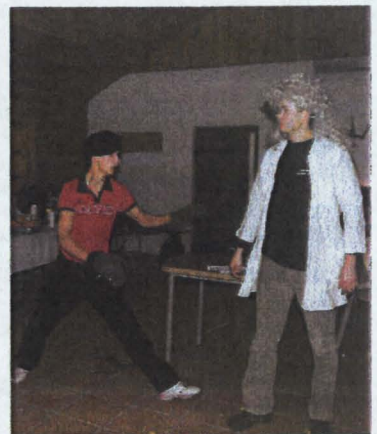
Kabaret w akcji