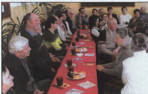
Humory dopisywały naszym seniorom

akademii. Następnie odbyło się wspólne śpiewanie kolęd i rozmowy przy herbatce. Seniorom towarzyszyła z aparatem Angelika Kukawska