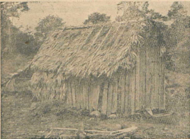
Chata brazylijskiego „Caboclo”.

Gdy w Europie jest już zimno, a nawet mroźno — tam na drugiej półkuli w słonecznej Brazylii lato w pełni. Mieszkańcy miast zjadają się lodami, mrożonym sokiem owoców, ale w głębi kraju praca wre.