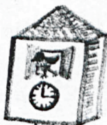
WRÓBEL W PRACY