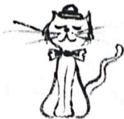
ARYS [KOT] RATA