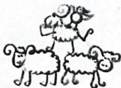
WRÓBEL NA BARANIET GÓRZE