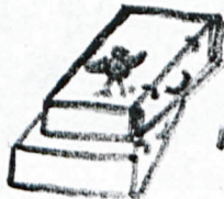
WRÓBEL NA WALIZKACH