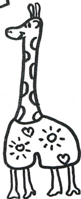
Żyrafa w bokserkach