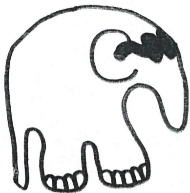
Słoń w okularach