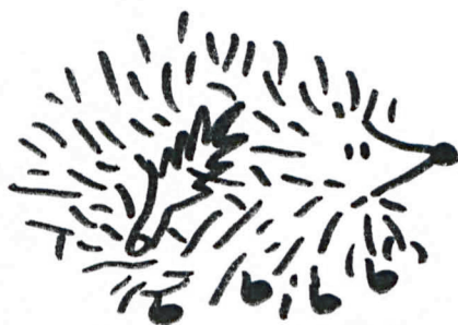
Jeżyk z listkiem na grzbiecie