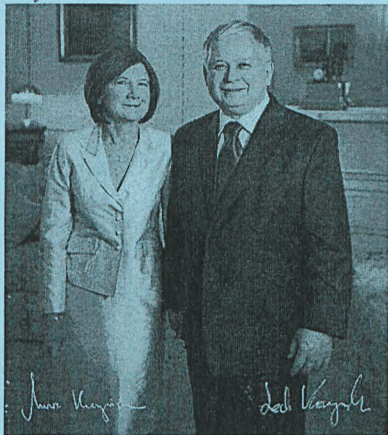
Para prezydencka – Lech i Maria Kaczyńscy

W smoleńskiej tragedii zginęło 96 osób – para prezydencka, ostatni prezydent na uchodźctwie Ryszard Kaczorowski, wicemarszałkowie sejmu, ministrowie, pracownicy Kancelarii Prezydenckiej, posłowie, senatorowie, najważniejsi urzędnicy państwowi, dowódcy wszystkich rodzajów wojsk, duchowni, załoga samolotu, przedstawiciele rodzin katyńskich.