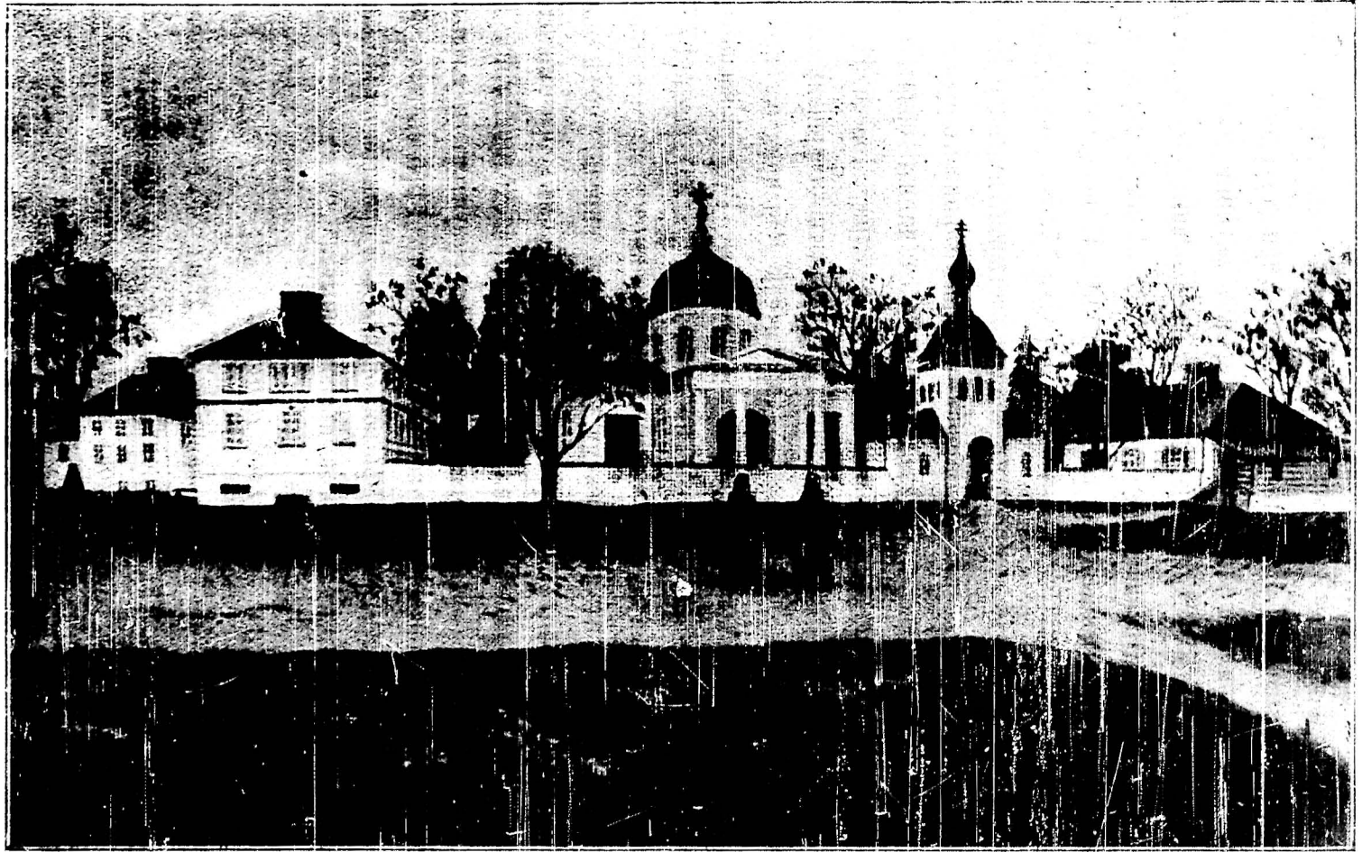
ОБЩІЙ ВИДЪ ЯБЛОЧИНСКАГО МОНАСТЫРЯ.