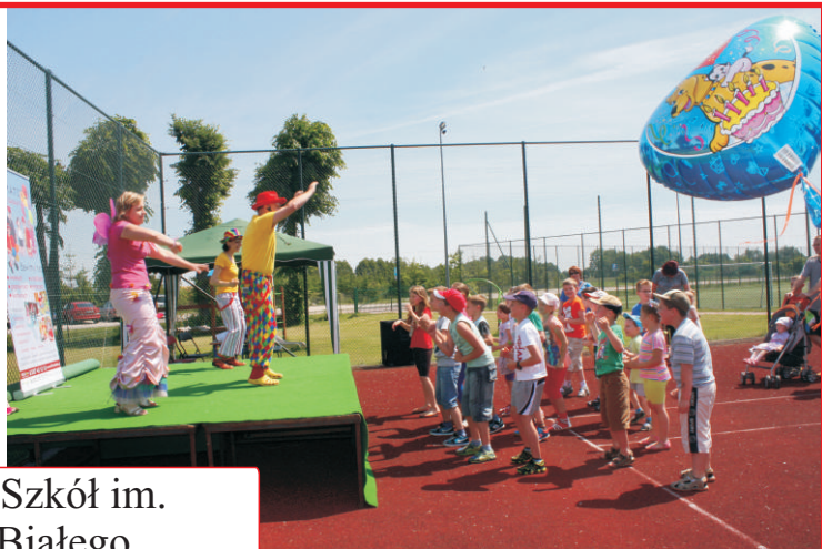
Zespół Szkół im. Orła Białego w Kobylanach