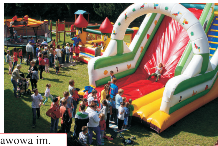
Szkoła Podstawowa im. Juliana Ursyna Niemcewicza w Neplach