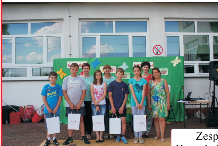
Zespół Szkół im. Kornela Makuszyńskiego w Małaszewiczach

Ponadto odbyły się konkurencje sportowo-rekreacyjne, których przygotowaniem i prowadzeniem zajęła się Dyrekcja oraz Kadra nauczycieli i pracowników poszczególnych szkół. Również rodzice wnieśli swój ogromny wkład przygotowując teren do zabawy. W tych dniach dla wszystkich dzieci biorących udział w imprezie zostały przygotowane drobne upominki, gadżety i słodycze ufundowane przez Wójta Gminy Terespol. Napoje dla dzieci sponsorował Gminny Ośrodek Pomocy Społecznej. Fundatorem hot dogów oraz wesołego miasteczka, które w tych dniach było całkowicie bezpłatne był Gminny Ośrodek Kultury. Na zakończenie dni pełnych wyśmienitej zabawy odbyły się dyskoteki. Imprezy były przednie, w tych dniach uśmiech i radość gościł na twarzach każdego!